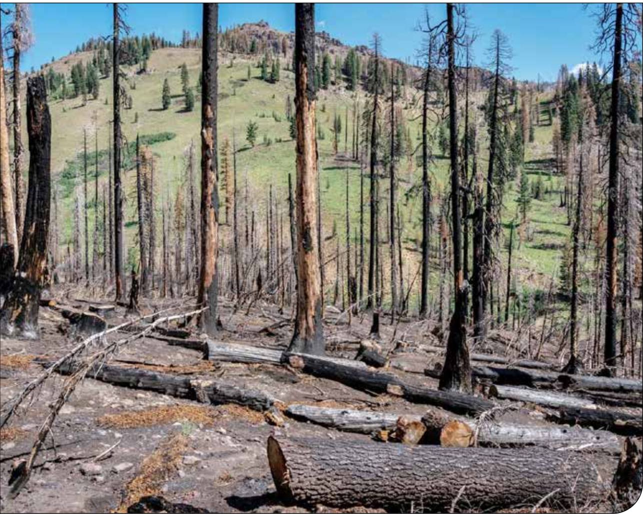
Guardian | 161

«راب نایت» از دانشگاه کالیفرنیا سن‌دیگو جمع‌آوری‌شده از طریق پروژه‌ی Borderlands Science می‌تواند برای ارتباط انواع خاصی از میکروبی‌ها با آنچه می‌خوریم، نحوه‌ی پیروی و بسیاری از بیماری‌ها استفاده کند.