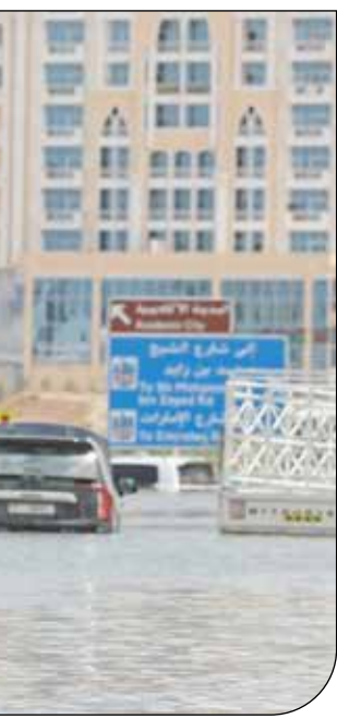
بارش‌های برق آسا و وقوع سیلاب در ایران و کشورهای حاشیه دریای عمان خسارت‌بار بوده است

فرمانده نیروی هوایی ارتش جمهوری اسلامی هم از آمادگی این نیرو برای اصابت قرار دادن اهداف خود به‌خصوص با سوخو ۲۴ خبر داد. امیر «حمید واحدی» در حاشیۀ رژهٔ روز ارتش دربارهٔ آمادگی جنگنده‌های سوخو ۲۴ این نیرو، گفت : نیروی هوایی با کمک وزارت دفاع و همکاری ارتش و ستاد کل آماده‌تر از همیشه است. آمادگی‌ای که امروز در زمینۀ سوخو۲۴ داریم، از همهٔ زمان‌ها بیشتر است و فقط سوخو ۲۴ نیست و در زمینۀ سایر پرندها هم آمادگی صد درصد داریم و همان‌طورکه فرمانده ارتش اعلام کرد اگر دشمن بخواهد خطای راهبردی داشته باشد، ضربه‌ای خواهد خورد که نتواند جبران کند.