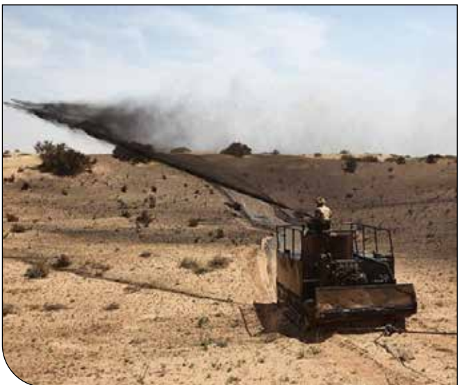
عملیات مالچ‌پاشی در مناطق بحرانی شرق کرمان

طبیعی تولید درختان ثمر مانند زرشک، سنجد، بادام، گردو و زالزالک را در دستور کار خود قرار دارد.