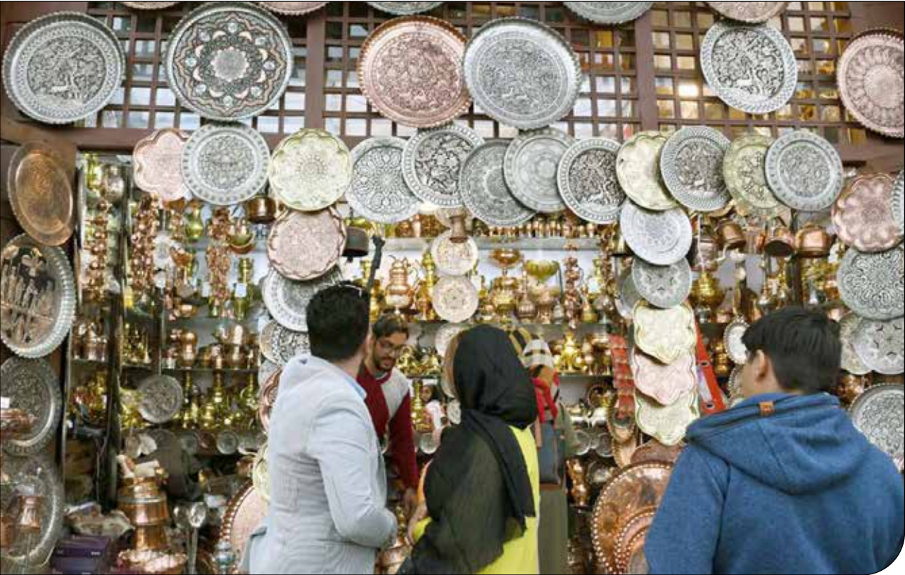
بازار طلا در تهران

محققان همچنین به اطلاعات ژنوم‌های اوراسیا پارینه‌سنگی نگاه کردند و این داده‌ها را با شواهد باستان‌شناسی برای تغییرات در فناوری ابزار سنگی مرتبط کردند. ازاین‌رو، آنها دریافتند انسان‌های مدرن احتمالاً در یک مرکز جمعیتی جمع می‌شوند که به‌عنوان پایگاهی برای مهاجرت‌های متعدد در سراسر اوراسیا عمل می‌کند. اما استنباط زاگنده مرکز جمعیت نیاز به افزودن یک مدل paleoclimate دارد که در مطالعهٔ جدید گنجانده شده است.