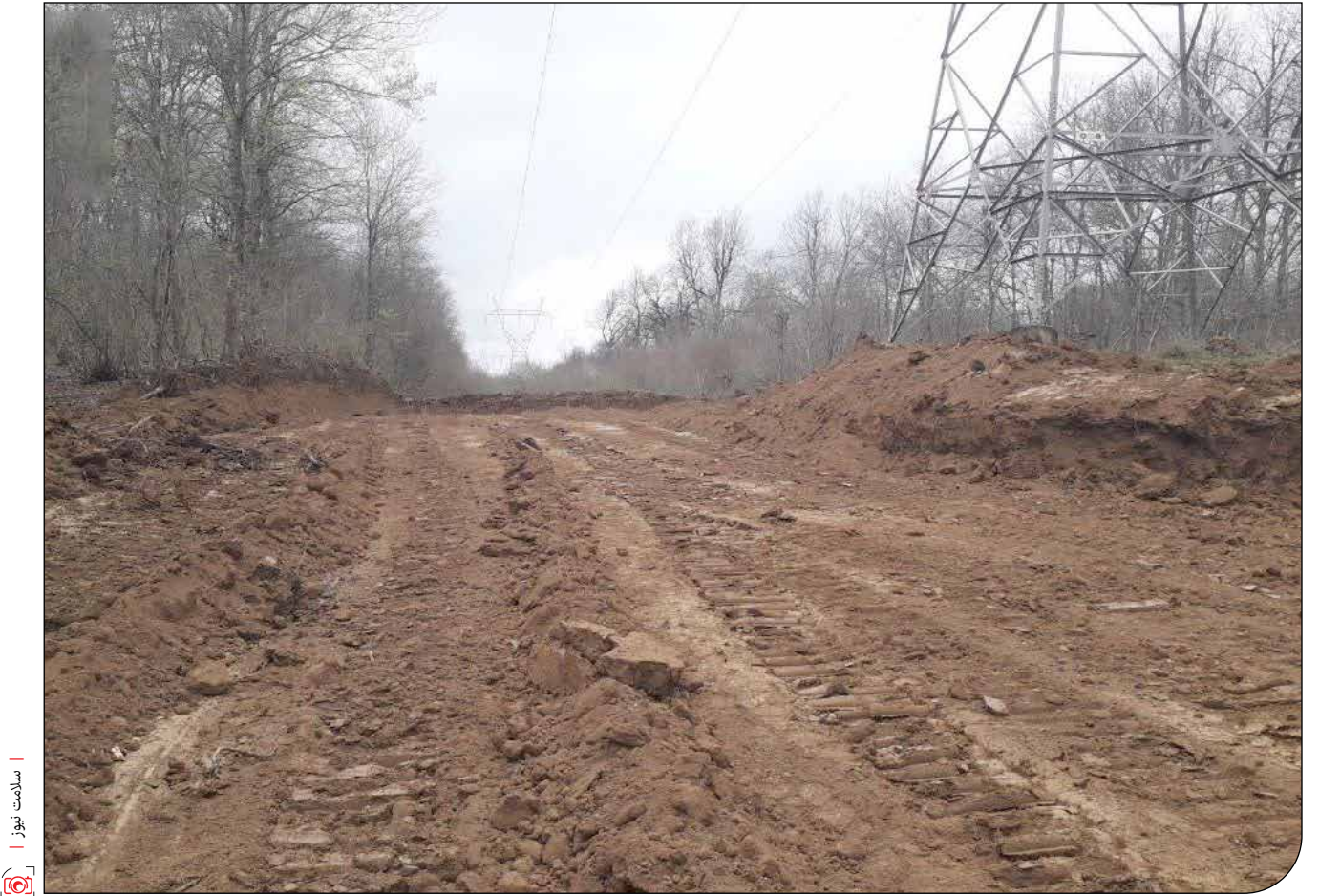
سازمان منابع طبیعی

در کنار مورد الیمالات این روزها دو مورد دیگر قطع درختان را شاهد بودیم که باز تیرتر آنها به تعداد درختان قطع‌شده برمی‌گشت. مدیرکل منابع طبیعی مازندران در گفت‌وگو با رسانه‌ها از شناسایی و دستگیری قاچاقچیان چوب در شهرستان بهشهر که ۲۲ فروردین به قطع ۷۰ درخت پرداختند، خبر داد. به‌گفته او، شش نفر از متخلفان منابع طبیعی که طی روزهای اخیر در جنگل‌های بهشهر اقدام به قطع ۷۰ درخت توسکا کردند، در حال حاضر در بازداشت به‌سر می‌روند.»