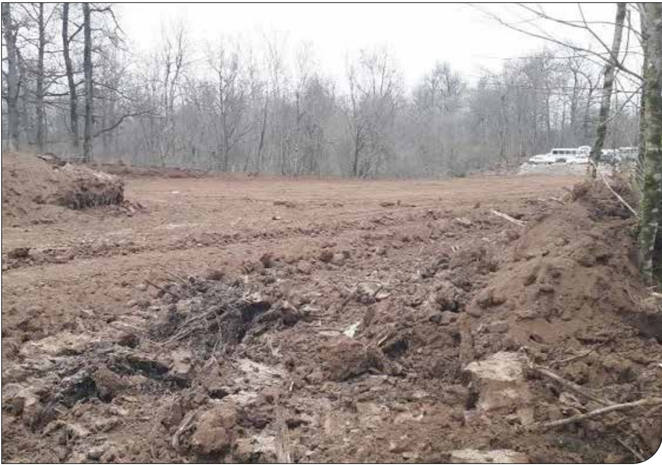
خبرگزاری صدا و سیما

دبیر شبکهٔ تشکل‌های منابع طبیعی مازندران: از بین رفتن هزاران تن خاک جنگلی فراموش شده است