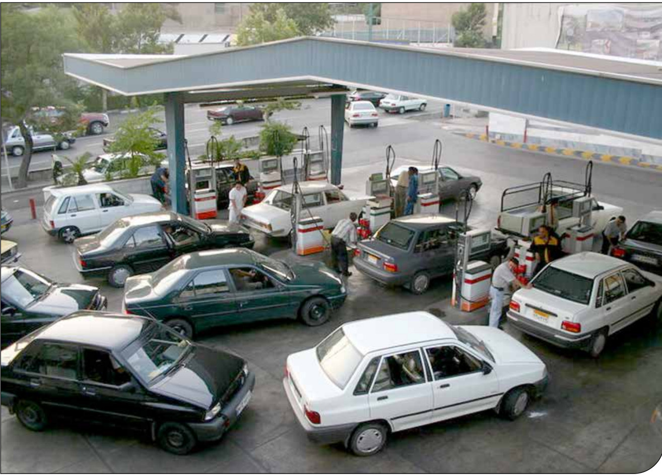
تداوم ناترازی بنزین در نوروز شکسته شد

در سال ۱۴۰۳، میانگین مصرف بنزین ۸ الی ۱۰ درصد نسبت به سال ۱۴۰۲ رشد خواهد کرد و به ۱۲۴ الی ۱۲۶ میلیون لیتر خواهد رسید