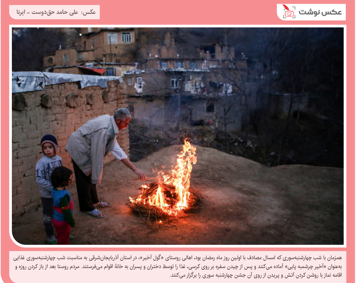
همزمان با شب چهارشنبه‌سوری که امسال مصادف با اولین روز ماه رمضان بود، اهالی روستای «گول آخیر»، در استان آذربایجان شرقی به مناسبت شب چهارشنبه‌سوری غذایی به‌عنوان «آخر چرشمبه پایی» آماده می‌کنند و پس از چیدن سفره بر روی کرسی، غذا را توسط دختران و پسران به خانه اقوام می‌فرستند. مردم روستا بعد از باز کردن روزه و اقامه نماز با روشن کردن آتش و پریدن از روی آن جشن چهارشنبه‌سوری را برگزار می‌کنند.