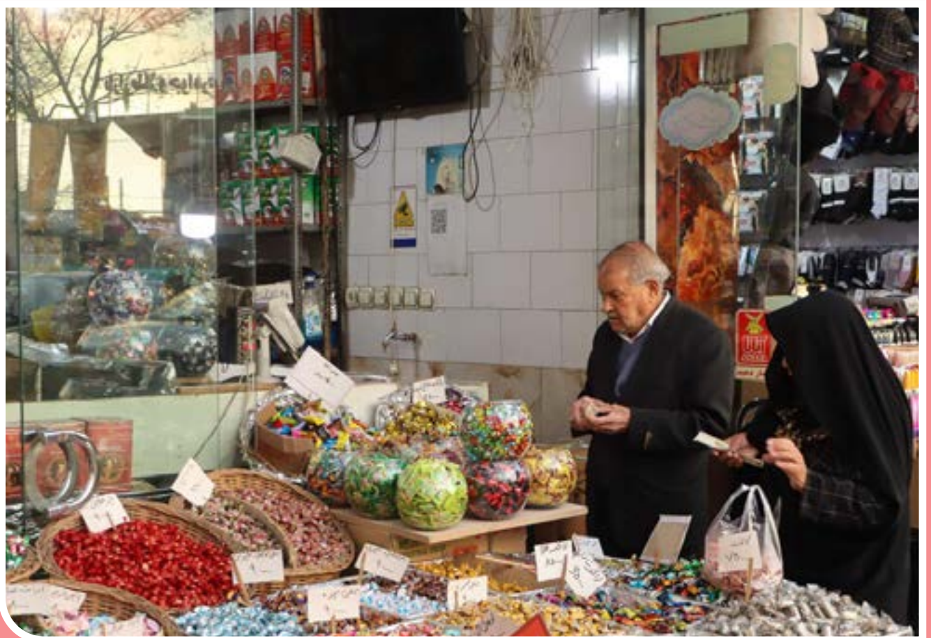
در آستانهٔ نوروز ۱۴۰۳ مردم اصفهان در تکاپوی تهیهٔ ملزومات سفرهٔ هفت‌سین و برگزاری عید نوروز هستند.