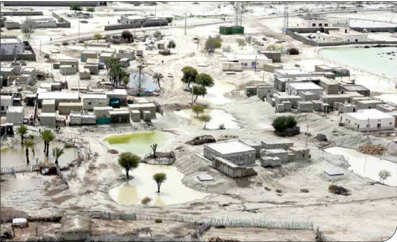
— — —

بیشترین خسارت سیلاب مربوط به منطقهٔ «دشتیاری» است اما مردم در «سرباز»، «سراوان»، «نیکشهر» و… در انتظار کمک هستند