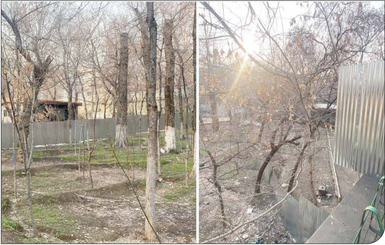
پس از فتنه‌های اخیر