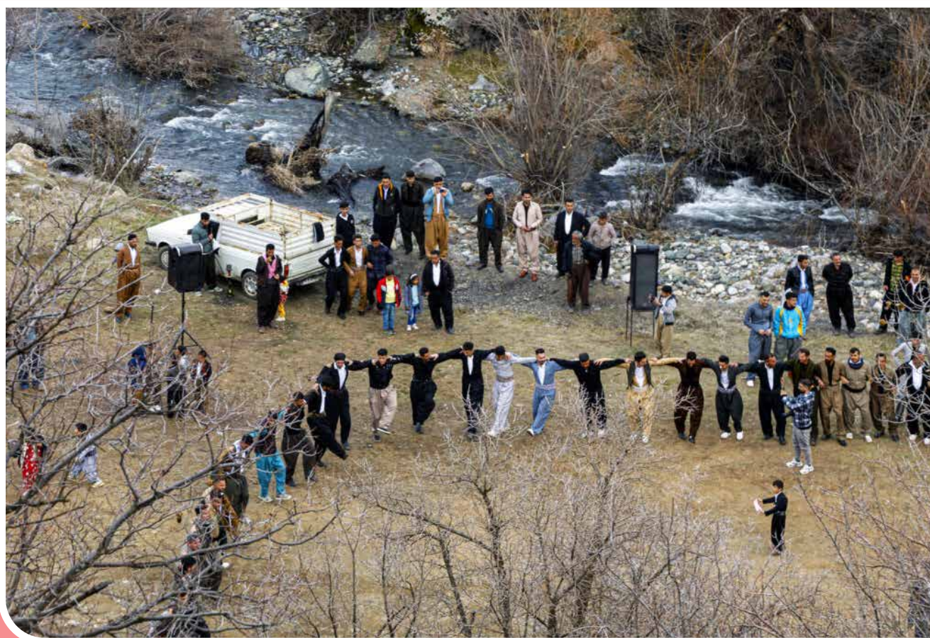
با گرم شدن زمین، پیشوازی از بهار در مناطق کردنشین از اسفند آغاز و برگزاری جشن نوروز تا اواسط فروردین در مناطق مختلف اجرا می‌شود. جشن و پایکوبی این مراسم شامل هل پهرکی، مشعل گردانی و روشن کردن آتش است. «دوپلوره»، روستایی از توابع بخش شرسویو شهرستان مریوان است که در استان کردستان واقع شده است.