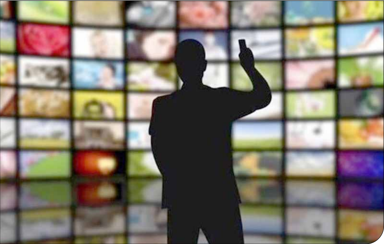
— تصویر —

او افزود: ما اگر بخواهیم در سطح اول دنیا کار کنیم به تجهیزات مدرن و پیشرفته‌ای نیاز داریم، با تجهیزات پیشرفته امور تحقیقاتی را می‌توانیم سریع‌تر، دقیق‌تر و کم هزینه تر انجام داد. معاون وزیر علوم افزود: اما وقتی تجهیزات پیشرفته وجود نداشته باشد اصلا نمی‌توانیم در سطح علمی اول دنیا حرفی برای گفتن داشته باشیم. بنابراین درموضوع «تجهیزات قدیمی که فرسوده شده اند» و «خرید تجهیزات جدید و مدرن» در این بحث مهم است.