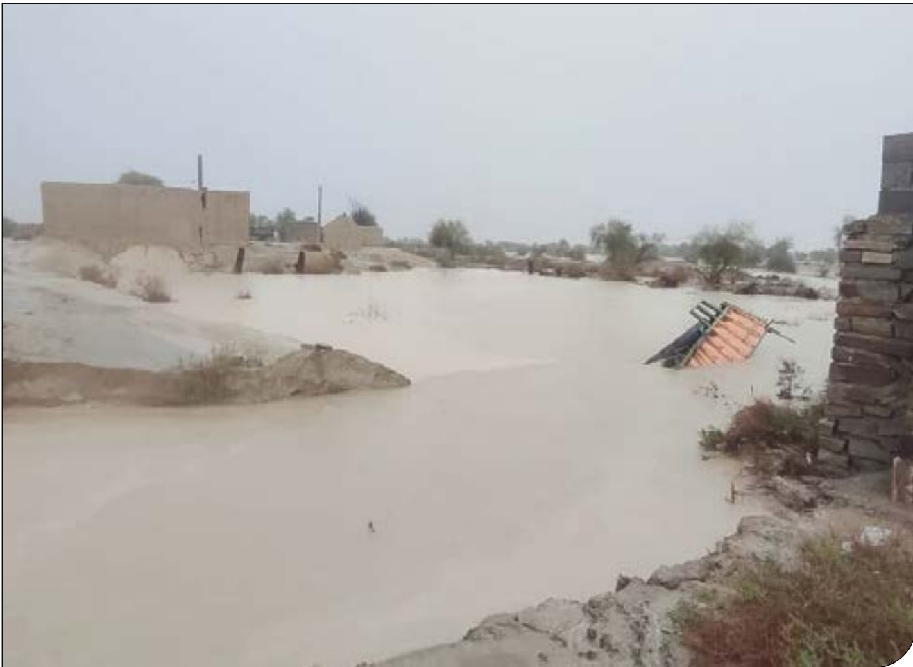
سیلاب در مناطق مختلف جنوب سیستان و بلوچستان

یک فعال اجتماعی در چابهار: این سیلاب بر همه منطقه اثر گذاشته و به‌جز دشتیاری، مناطق دیگری مثل فنوج، آهوران، قصرقند، سرباز و... هم آسیب دیده‌اند