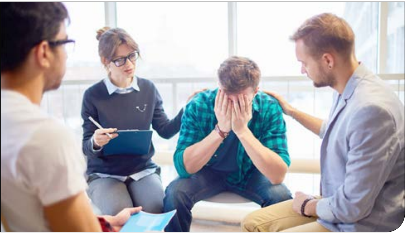
— ۵۲ — — ۱۳۵ —

همچنین، مشاهدات راداری گلدستون، امکان اندازه‌گیری کلیدی فاصله سیارک از زمین از هنگام عبور از کنار آن فراهم کردند. این اندازه‌گیری‌ها می‌توانند به دانشمندان «مرکز مطالعات اجرام نزدیک به زمین» (CNEOS) ناسا کمک کنند تا محاسبات را درباره مسیر مداری سیارک به دور خورشید اصلاح کنند. سیارک OSY ۲۰۰۸ هر ۲.۶ سال یک بار به دور خورشید می‌چرخد، از درون مدار زهره می‌گذرد و از مدار مریخ در دورترین نقطه آن عبور می‌کند. مرکز مطالعات اجرام نزدیک به زمین که توسط آزمایشگاه پیش‌رانش جت ناسا مدیریت می‌شود، همه مدارهای یک جرم نزدیک به زمین را برای ارزیابی خطرات احتمالی برخورد محاسبه می‌کند. با توجه به نزدیکی مدار ۲۰۰۸ OSY به مدار زمین و اندازه آن، این سیارک به‌عنوان یک سیارک بالقوه خطرناک طبقه‌بندی می‌شود، اما نزدیک‌ترین فاصله آن به سیاره ما در حداقل ۲۰۰ سال اخیر، روز دوم فوریه بوده است.