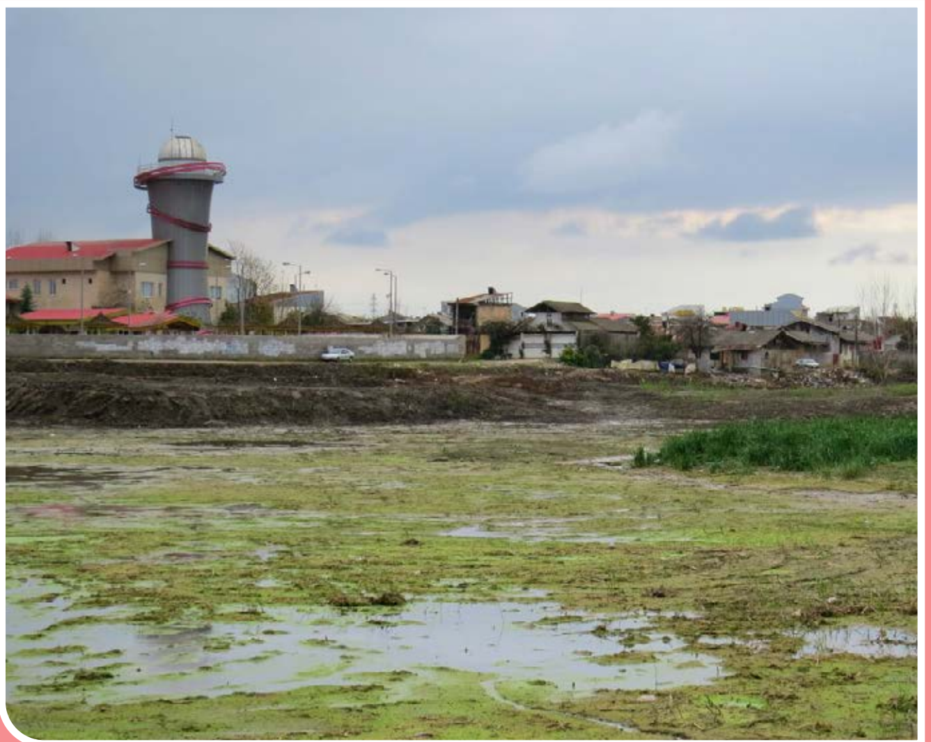
تالاب «عینک» که در شهر رشت واقع شده، بزرگترین تالاب شهری ایران و دومین تالاب بزرگ استان گیلان است. ساخت‌وساز در حریم تالاب، ورود فاضلاب‌های شهری و صنعتی، رهاسازی زباله، برداشت بی‌رویه آب توسط کشاورزان و بی‌توجهی مسئولان متولی، به تدریج باعث خشک شدن و از بین رفتن بخش وسیعی از تالاب شده و آن را در آستانه نابودی قرار داده است.