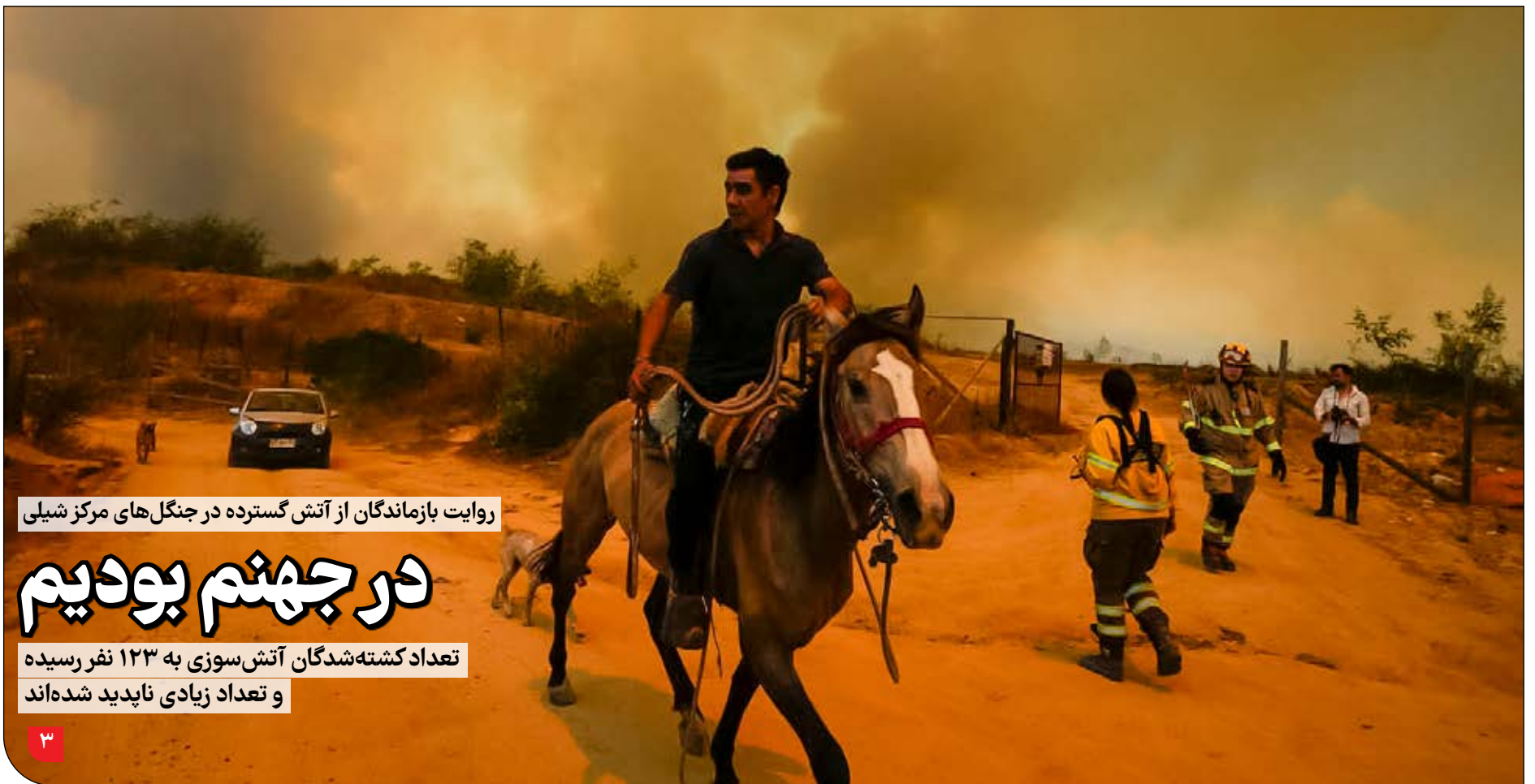
روایت بازماندگان از آتش گسترده در جنگل‌های مرکز شبلی

دومین همایش گردشگری و سرمایه‌گذاری سبزیکی از برنامه‌های جنبی هفدهمین نمایشگاه بین‌المللی گردشگری است