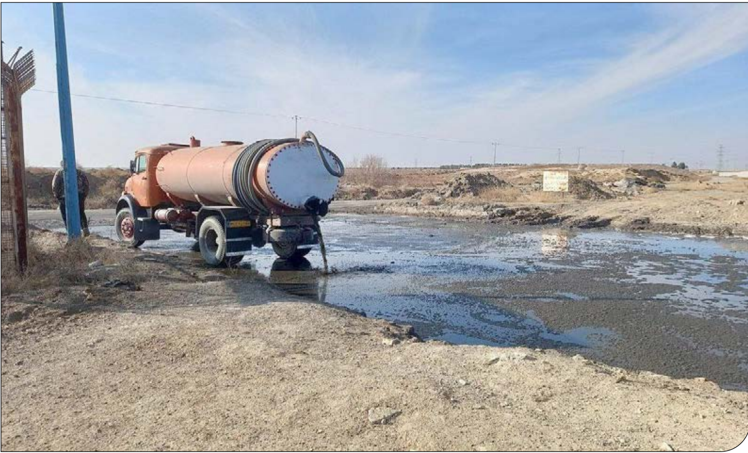
فصلی از رودخانه اساطیری کشف‌شده که با حدود ۳۰۰ کیلومتر طول جزو بزرگترین رودخانه‌های شمال‌شرق کشور است، شروع شده و این فاضلاب‌ها برای آبیاری حدود هفت هزار هکتار از زمین‌های کشاورزی تولیدکننده محصولات کشاورزی موردنیاز مردم مشهد و اطراف مشهد استفاده می‌شود.

ممانعت از کشت فاضلابی در حاشیه رودخانه و ایجاد منابع درآمدی جایگزین برای کشاورزان و دامپروران حاشیه این رودخانه می‌تواند راه‌گشا باشد