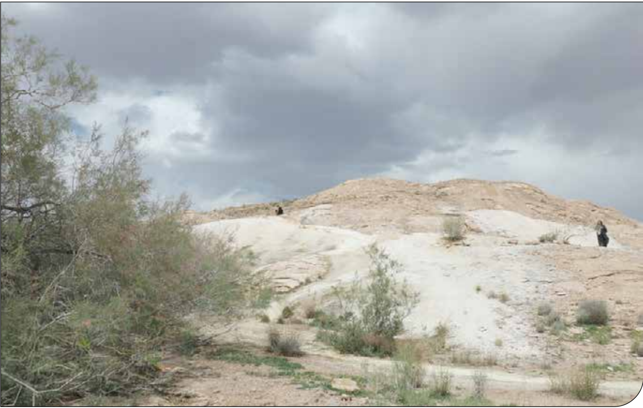
-تقلا برای کشتن آبخوان‌ها

محاسبهٔ بیلان آب نشان می‌دهد اگر معدن تا عمق ۲۸۰ متری زمین پیش برود، سالانه ۱۲ میلیون مترمکعب آب از دست خواهد رفت