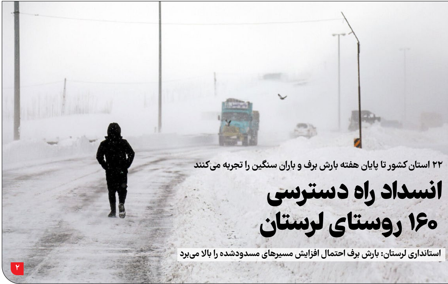
استانداری لرستان: بارش برف احتمال افزایش مسیرهای مسدود شده را بالا می‌برد

امضاکنندگان نامه، حفاظت مشارکتی را الگویی همه‌جانبه از حفاظت معقول از سرزمین با مشارکت ذی‌نفعان دانسته‌اند