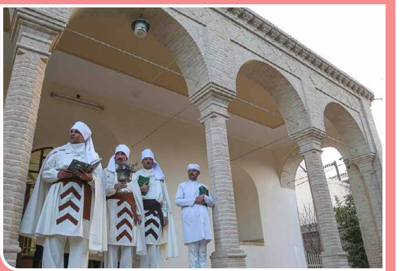
جشن سده، یکی از جشن‌های ایرانی است که در آغاز شامگاه دهم بهمن‌ماه برگزار می‌شود. این آیین با ادعیه‌خوانی و سرودخوانی موبد موبدان همراه است. ایرانیان قدیم بر این باور بودند که در این زمان، لوح و شدت سرما سبزی می‌شود، به همین دلیل همه گرد هم جمع می‌شدند و تلی بزرگ از خار و خس و هیزم فراهم می‌کردند و با فرارسیدن تاریکی شب، آتش می‌افروختند.