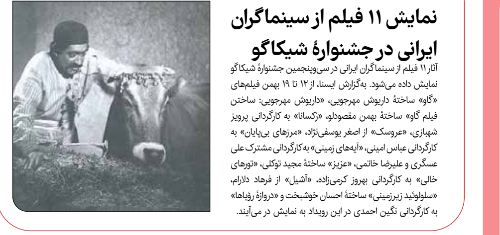
نمایش ۱۱ فیلم از سینماگران ایرانی در جشنواره شیکاگو