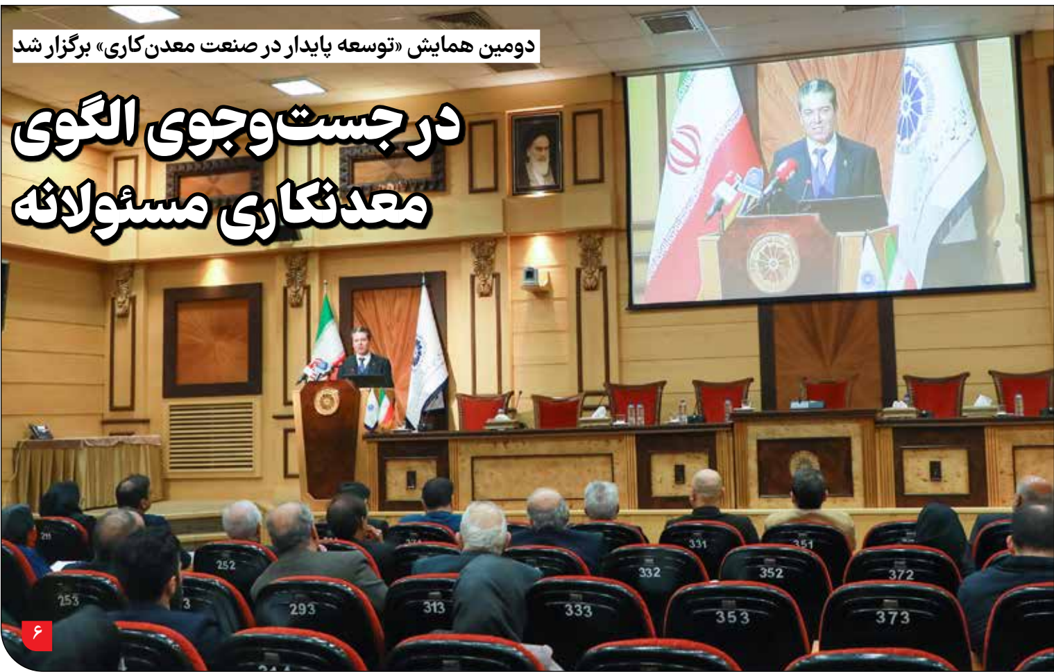
دومین همایش «توسعه پایدار در صنعت معدن کاری» برگزار شد