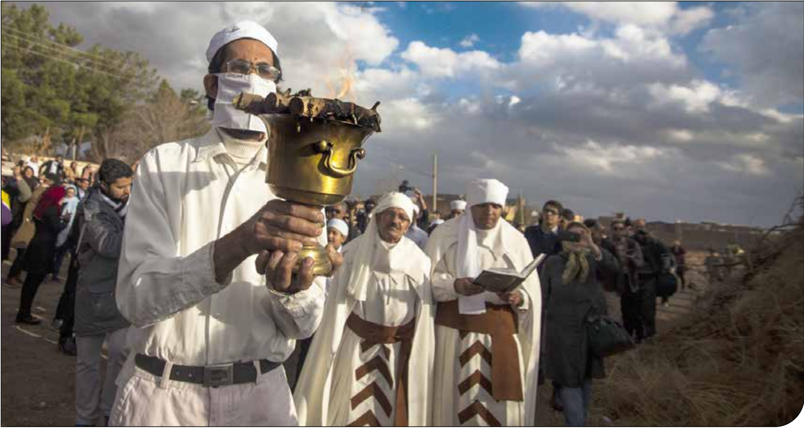
کمان ۱ (۶)

جشنی باستانی که برای استقبال از نوروز برگزار می‌شود