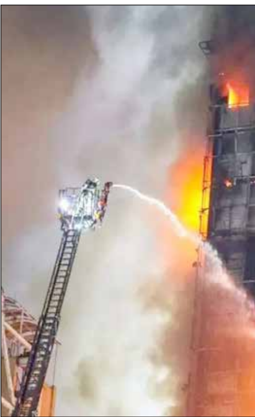
آتش‌نشانی در حال آتش‌نشانی نمای ساختمان‌های پایتخت

شورای شهر تهران طرح یک فوریتی حضور نمایندهٔ آتش‌نشانی در «کمیتهٔ نما» را تهیه کرد