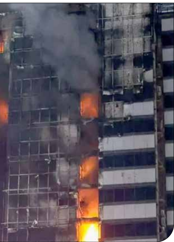
نمای ساختمان‌های پایتخت در حال آتش‌نشانی