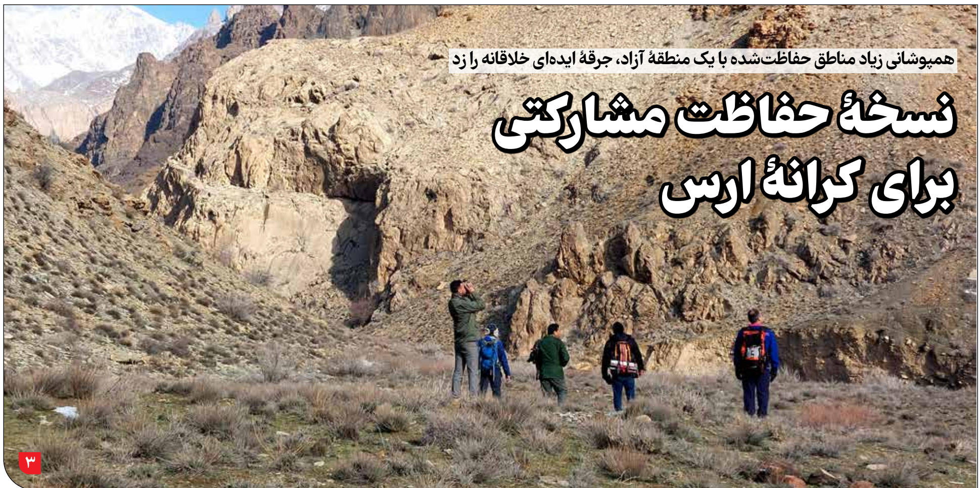
همبوشانی زیاد مناطق حفاظت شده با یک منطقه آزاد، جرقه ایده ای خلاقانه را زد

وزیر آموزش و پرورش در واکنش به تصادفات اخیر معلمان فقط به یک پیام تسلیت بسنده کرد