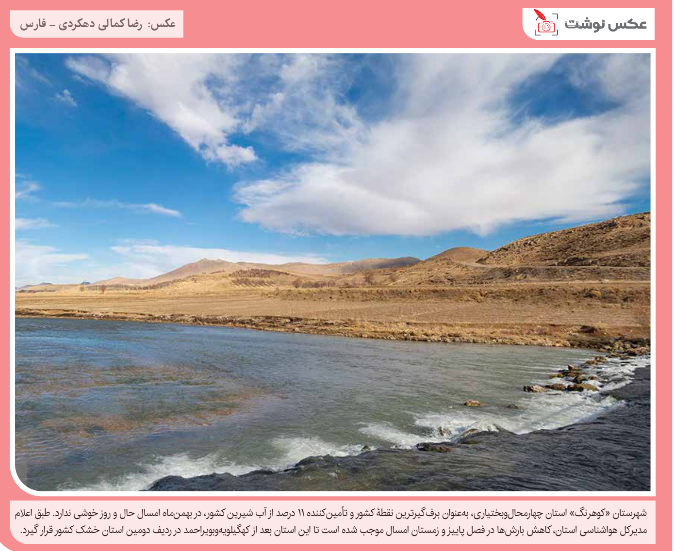
شهرستان «کوهرنگ» استان چهارمحال و بختیاری، به‌عنوان برف‌گیرترین نقطه کشور و تأمین‌کننده ۱۱ درصد از آب شیرین کشور، در بهمن‌ماه امسال حال و روز خوشی ندارد. طبق اعلام مدیرکل هواشناسی استان، کاهش بارش‌ها در فصل پاییز و زمستان امسال موجب شده است تا این استان بعد از کهگیلویه و بویراحمد در رتبه دومین استان خشک کشور قرار گیرد.