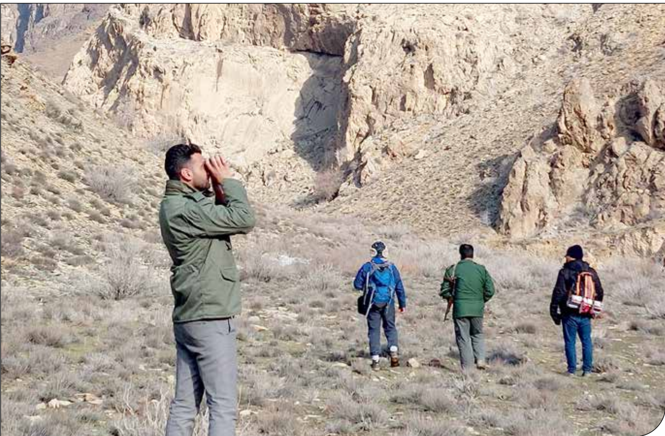
- از چپ

تنوع‌بخشی به معیشت‌های پایدار و سازگار با محیط زیست و رونق رشته‌های مختلف اکوتوریسم مانند پرندنگری و ... می‌شود