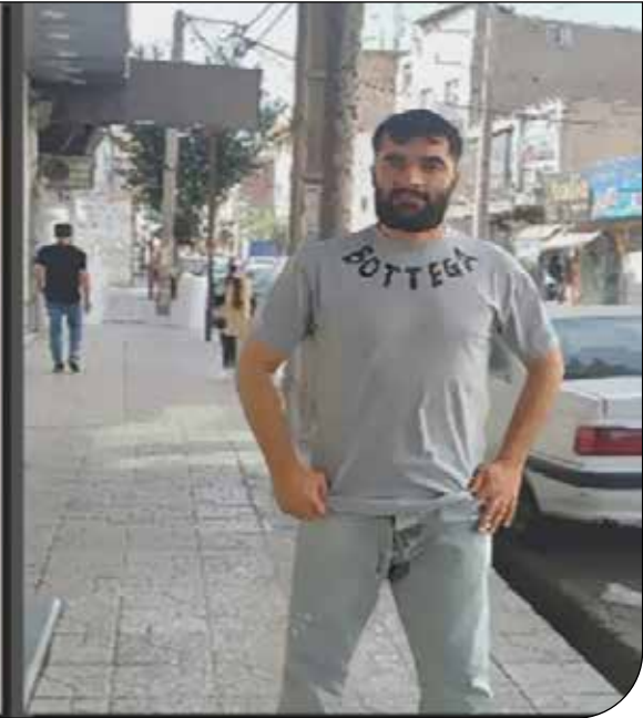
— 10 —

اظهارات گروسی درحالی مطرح می‌شود که «محمد اسلامی»، رئیس سازمان انرژی اتمی، روز چهارشنبه در جمع خبرنگاران در پاسخ به پرسشی دربارهٔ سطح دسترسی بازرسان آژانس انرژی اتمی به تأسیسات هسته‌ای ایران گفت: ما عضو پادمان هستیم و مطابق پادمان با آژانس همکاری می‌کنیم و بازرسان آژانس نیز طبق پادمان کارشان را عزام می‌کند و در تأسیسات هسته‌ای کشور دوربین نصب می‌کند.