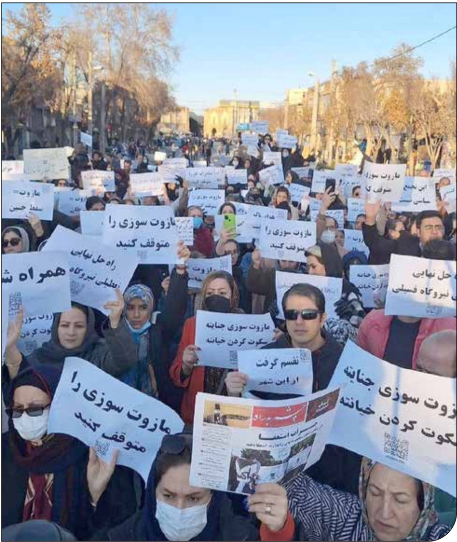
در سال‌های اخیر، روند اعتراض و برگزاری تجمع برای مقابله با آلودگی هوا در کشور رشد قابل توجهی داشته است

شماره افتاده است. علاوه بر اینها اردکانی‌ها هم یکی از بدترین سال‌ها را به لحاظ هوای سالم تجربه کردند.