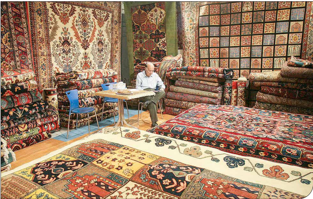
فرش ایرانی در یک فروشگاه