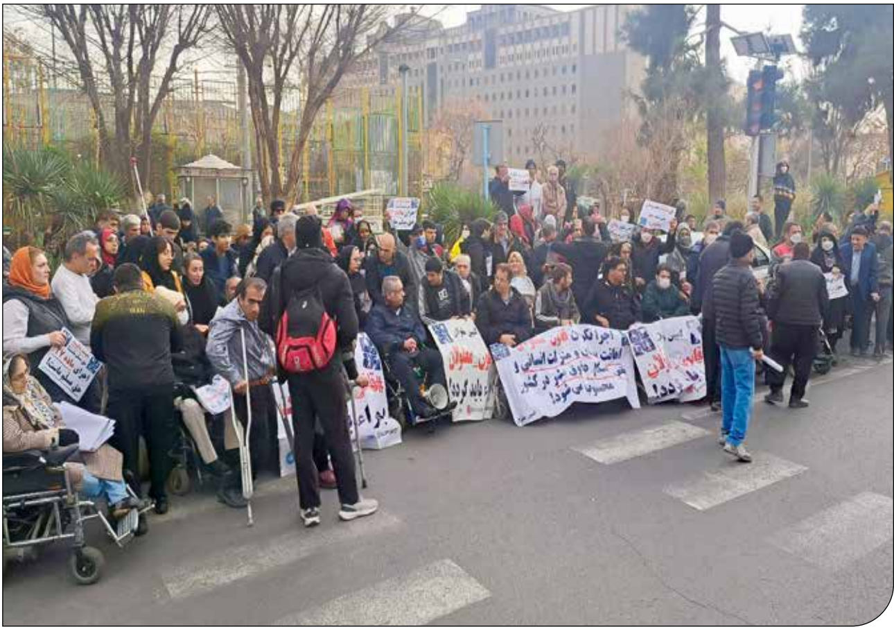
سازمان برنامه و بودجه جلوی معترضان به اجرا نشدن قانون را گرفت

نتایج نهایی آزمون استخدامی وزارت آموزش و پرورش ویژه رشته شغلی مربی امور آموزش معلولین سال ۱۴۰۲ از طریق سایت مرکز آزمون جهاد دانشگاهی اعلام شد. به گزارش گروه علم و آموزش ایرنا از جهاد دانشگاهی، ثبت نام آزمون استخدامی جدید آموزش و پرورش ویژه رشته شغلی مربی امور آموزش معلولین ۱۷ شهریور آغاز شد و تا دوم مهر نیز ادامه داشت. آزمون ۲۱ مهرداد در مراکز استان‌ها برگزار شد. در مرحله ثبت نام این آزمون که برای جذب یک هزار گفتاردرمان و کار درمان صورت گرفت، دو هزار و ۴۱۶ نفر نام نویسی کردند. «حمید طریفی حسینی»، معاون وزیر آموزش و پرورش و رئیس سازمان آموزش و پرورش استثنایی کشور گفت: در مرحله اول یک هزار و ۱۵۹ نفر نمره علمی لازم را برای ورود به مرحله ارزیابی تکمیلی کسب کردند که شامل ۹۰۹ خانم و ۲۵۰ آقا هستند. در اطلاعیه سازمان اداری و استخدامی کشور آمده است: به اطلاع شرکت کنندگان در مراحل بررسی مدارک و مستندات خوداظهاری و ارزیابی تکمیلی آزمون استخدامی وزارت آموزش و پرورش رشته شغلی مربی امور آموزش معلولین سال ۱۴۰۲، موضوع مجوز شماره ۹۹۶۶۵ مورخ سوم اسفند ۱۴۰۲ و شماره ۲۴۴۳۷ مورخ بیستم خرداد ۱۴۰۲ سازمان اداری و استخدامی کشور می‌رساند نتایج یک برابر ظرفیت آزمون این از طریق درگاه اطلاع رسانی مرکز آزمون جهاد دانشگاهی به نشانی hrtc.ir قابل مشاهده است. متقاضیان ضمن مراجعه به درگاه مرکز آزمون جهاد دانشگاهی، چنانچه در ردیف قبول شدگان نهایی آزمون مزبور قرار گرفته‌اند، برای طی سایر مراحل استخدام (گواهی عدم سوءسوابق، آزمایش‌ها و معاینات پزشکی، تشکیل پرونده استخدامی و آماده‌سازی برای شرکت در دوره‌های مهارت‌آموزی) اقدام کنند.