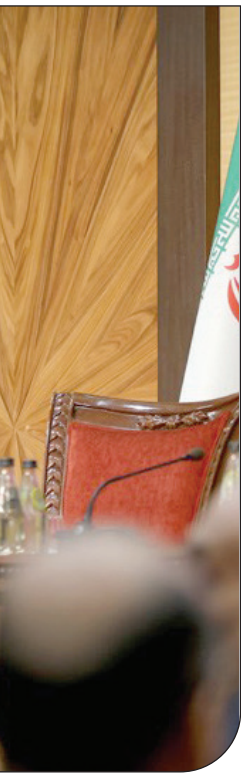
اتاق بزرگانی ایران