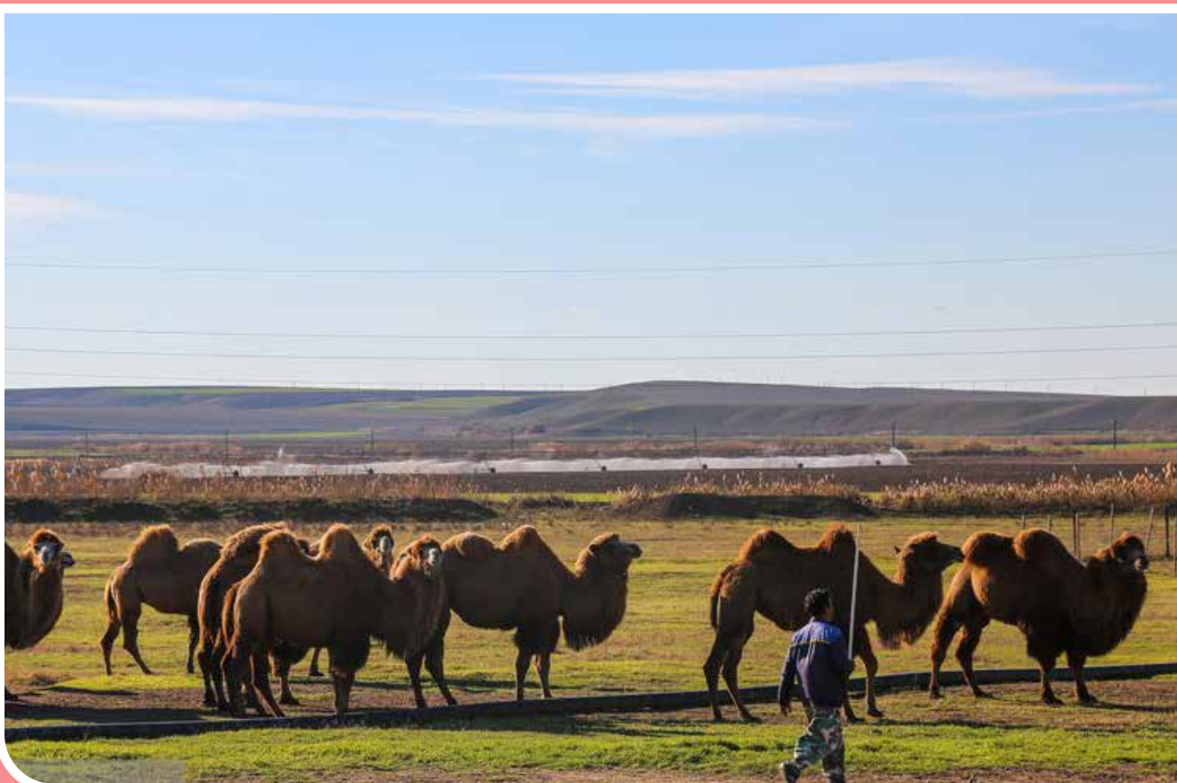
مزرعه شتر دوکوهانه در جعفرآباد مغان استان اردبیل شتر دوکوهانه یکی از گونه‌های اهلی ارزشمند استان اردبیل است که طرح حفظ و صیانت از آن آغاز شده است. در حال حاضر ۲۴۵ نفر شتر دوکوهانه در استان اردبیل وجود دارد که ۱۸۱ نفر آن توسط بخش خصوصی و مابقی در بخش دولتی پرورش داده شده‌اند.