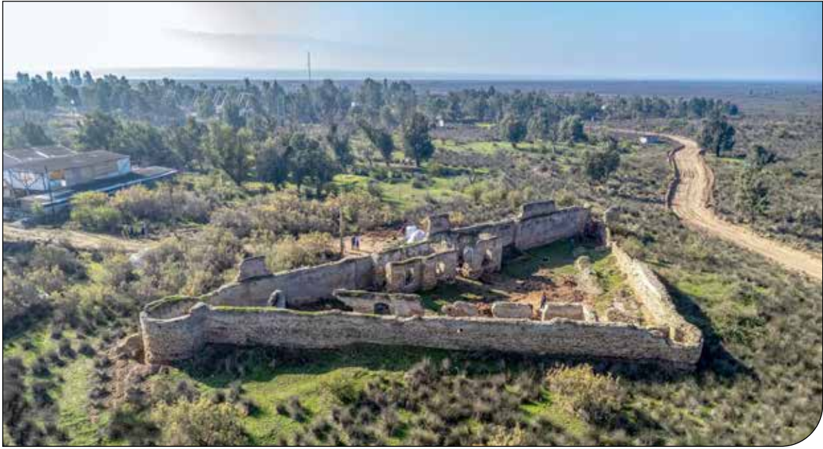
— ۱ —

بر این اساس بازگیری و انتقال ۱۵ میلیون تن کالا در سال در مسیر کریدور های بین المللی، گسترش سکونتگاه ها و شهرهای موجود و ایجاد شهرهای جدید به میزان ۲ میلیون و پانصد هزار نفر، گسترش زیرساخت های فرهنگی و آموزشی، تولید و انتقال ۱۷ هزار مگاوات برق، تأمین و انتقال ۳ میلیون متر مکعب آب شرب کشاورزی و صنعتی، ایجاد ۴۰۵۰ تخت درمانی و ایجاد ۵ منطقه پیشران اقتصادی در سواحل و توسعه صنایع نفت و گاز و پتروشمی، معنی و گردشگری، شبلات و کشاورزی، کشتی سازی و پشتیبانی بندری، صنایع الکترونیک و حمل و نقل از جمله اهداف برنامه ۵ ساله سواحل مکران است.