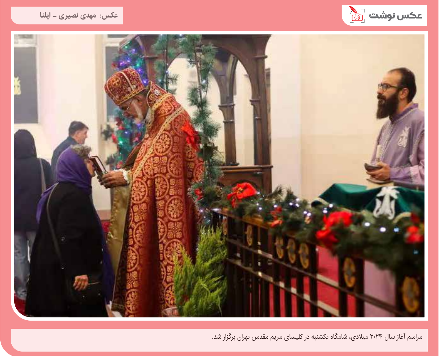
مراسم آغاز سال ۲۰۲۴ میلادی، شامگاه یکشنبه در کلیسای مریم مقدس تهران برگزار شد.