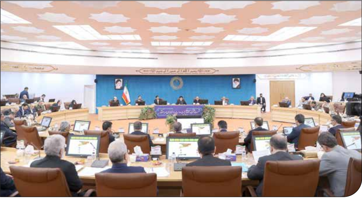
ریاست جمهوری | راست

رئیس جمهوری می‌گوید از هیچ نامزدی در انتخابات حمایت نخواهد کرد