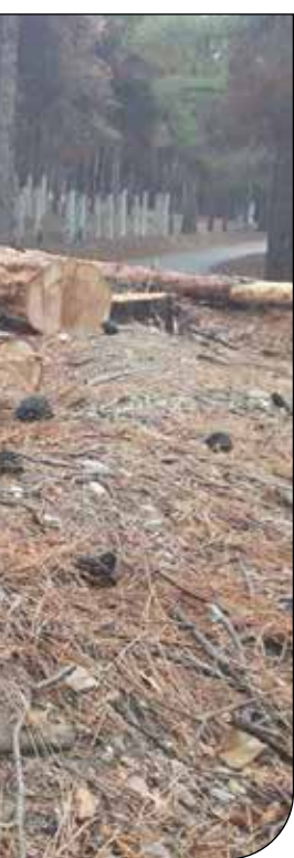
فعالان محیط زیست در نامه‌ای سرگشاده، به طرح‌های شهرداری‌ها که اراضی ملی را هدف قرار داده، اعتراض کردند

مدیرکل امور تربیتی مشاوره و مراقبت در برابر آسیب‌های اجتماعی وزارت آموزش‌وپرورش با بیان اینکه حدود ۷۰ هزار رابط مشاور در مدارس کشوربرای این منظور داوطلب شده‌اند،گفت: این افراد باید در یک بازهٔ زمانی کوتاه آموزش‌های لازم برای اجرای این برنامه را دریافت کنند. لذا با دسترس ویژهٔ سلامت روان وزارت بهداشت در این زمینه رایزنی‌هایی صورت گرفته است تا در چارچوب وظایف وزارت بهداشت در سند ائتلاف نماد، از ظرفیت وزارت بهداشت برای آموزش رابطان مشاور استفاده شود.