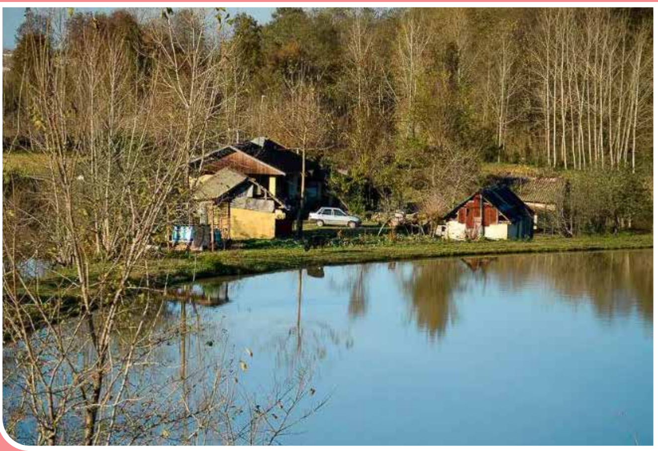
دریاچه سد خاکی «سقالکسار» یکی از جاذبه‌های در دل جنگل‌های هیرکانی، در ۱۵ کیلومتری جنوب شهر رشت واقع شده است. زیبایی‌های فصول مختلف این دریاچه توجه بسیاری از گردشگران را به خود جلب کرده است.