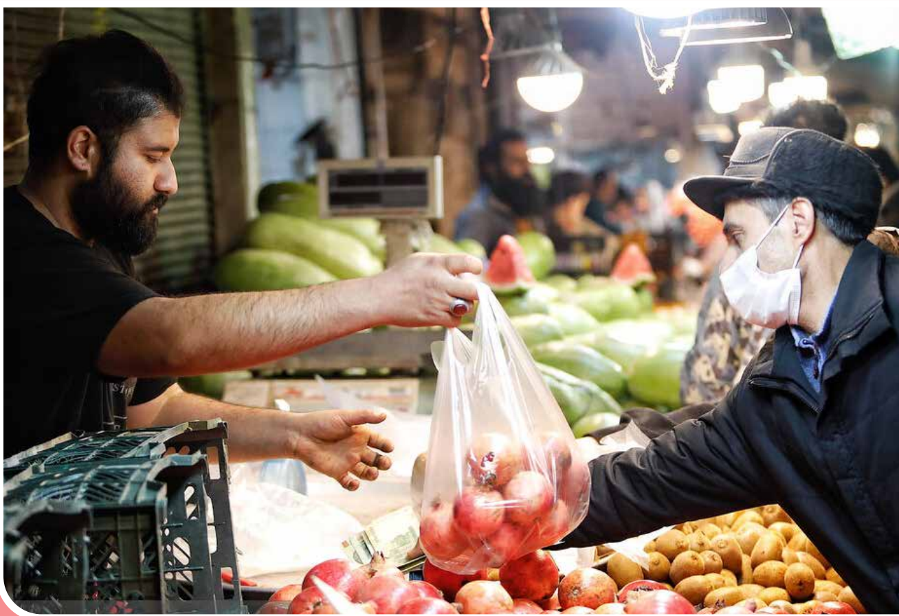
در آستانه شب یلدا که خانوادهها در کنار یکدیگر جمع می‌شوند، بازار کاسیان همدان رونق دوباره گرفته و مردم در حال تهیه وسایلی مورد نیاز خود از جمله میوه، شیرینی و آجیل هستند.