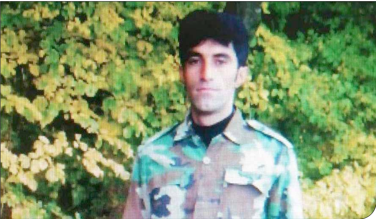
[عکس] [عکس] [عکس] [عکس]

پس از تحقیقات انجام شده فرد مظنون یعنی یک مرد حدود ۴۶ ساله با هماهنگی مرجع قضایی دستگیر شد