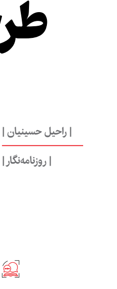
— ۱۵ —

یک هنرمند: این هنر قدیمی سال‌های زیادی در کرمان متروک بوده است و بیشتر ظروف مسی خانه‌ها را به دستفروش می‌دادند، زیرا ظاهراً بی‌ارزش و دست‌وپاگیر شده بود. در سال‌های اخیر بازار مسگری تکانی خورد و سعی کردند هنر مسگری را احیا کنند. در روزگار زوال هنر اصیل مسگری، ظروف ماشینی مسی که کار اصیلان بود، جایگزین هنر مسگری شد