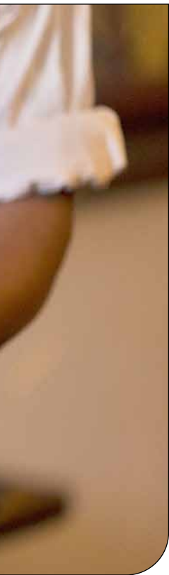
— ۳ —