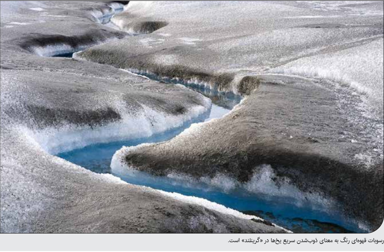
رئوسبات قهوه‌ای رنگ به معنای ذوب‌شدن سریع یخ‌ها در «گرینلند» است.