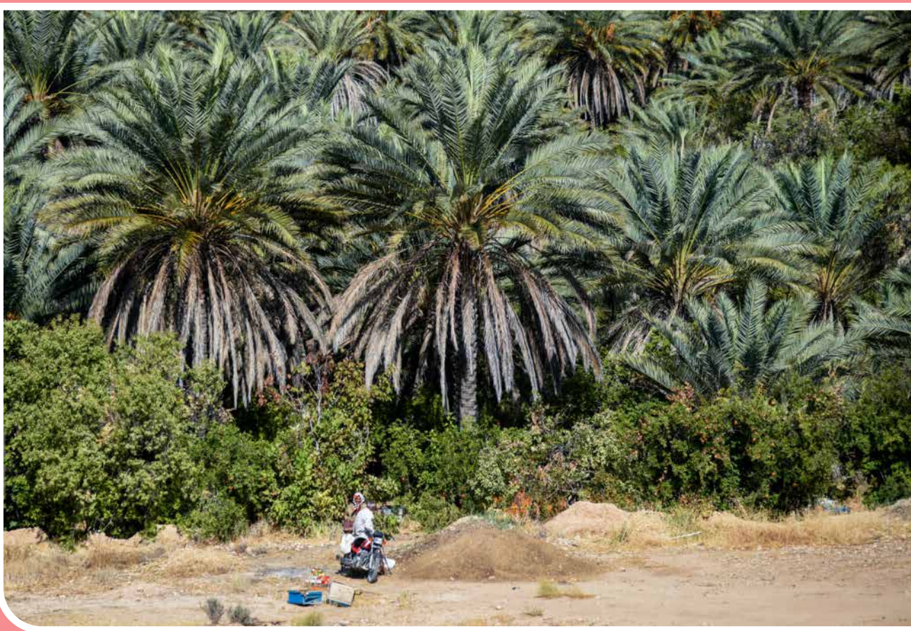
شهر «خاوران» در نیمه جنوبی استان فارس واقع شده است. آب‌وهوای مطبوع و کوهستانی این شهر باعث شده درختان گرمسیری و سردسیر در کنار هم رشد کنند و محصولات متنوعی از جمله انار و خرما در آن کشت شود. نخلستان‌های انبوه، یکی از جاذبه‌های گردشگری خاوران است.