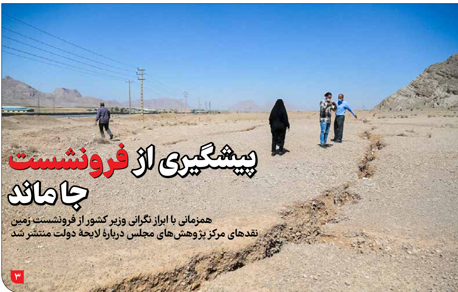
پیشگیری از فرونشست جاماند

بنا به اعلام مسئولان میراث فرهنگی پرونده تا اول فوریه (۱۲ بهمن) در یونسکو اعلام وصول می‌شود