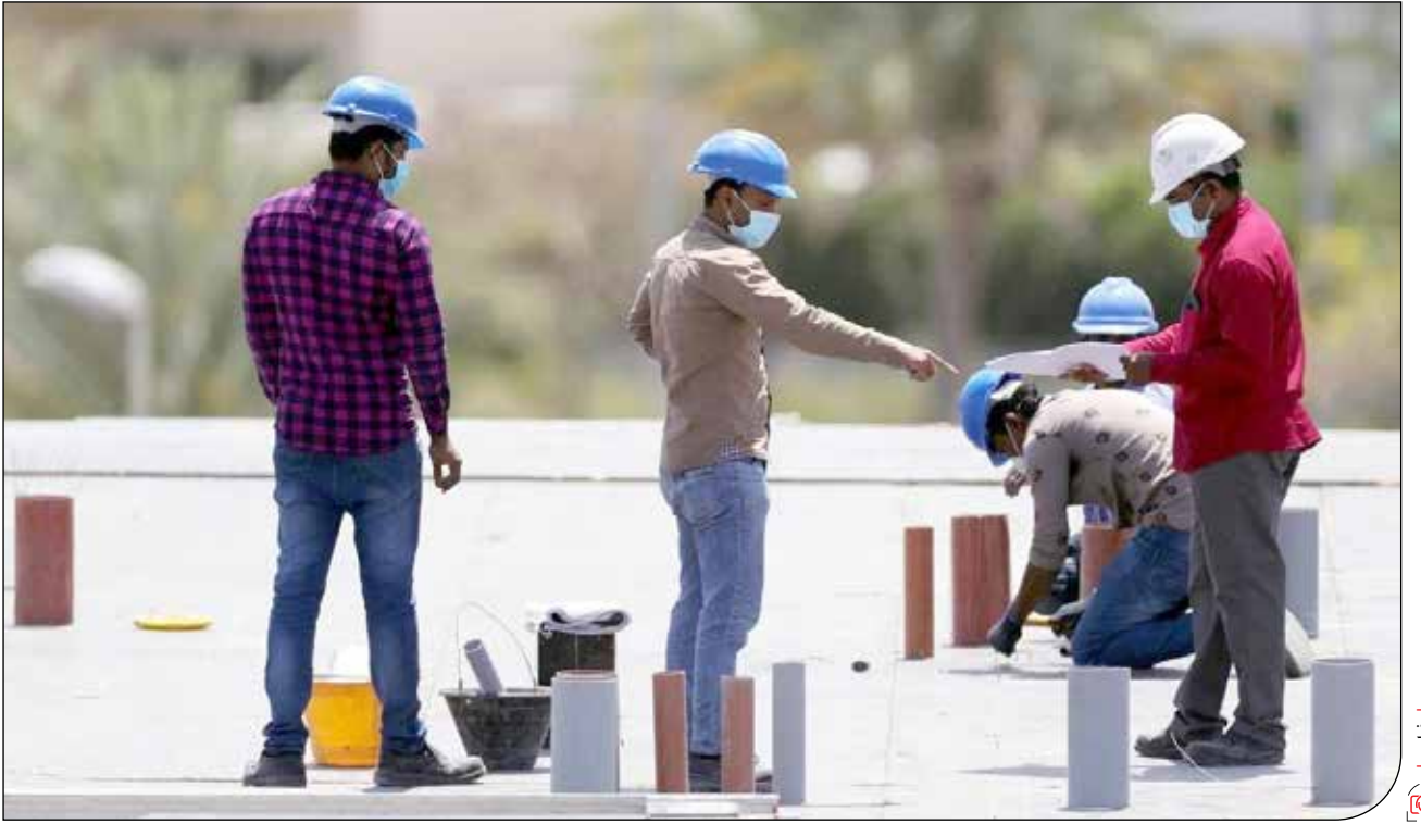
فارس | (۱۳۶)