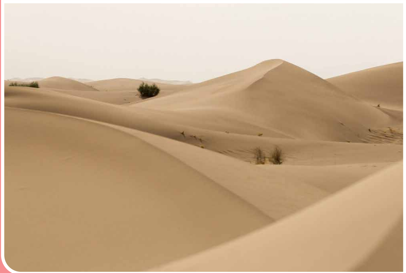
استان یزد با طبیعت کویری، جاذبه‌های زیادی در دل خود دارد و کویر «ریگ زرین» یکی از آنها است. این کویر که با نام کویر «مغستان» نیز شناخته می‌شود حدود ۵۰ کیلومتر طول و ۱۳ کیلومتر عرض دارد و بعد از کویر «لوت»، بلندترین دیواره‌های ماسه‌ای در ایران را دارد.