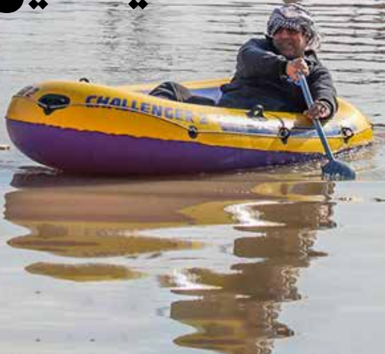
سیل سال ۱۳۹۸ در خوزستان، ایران

از احتمال بارش‌های فراتر از نرمال در نیمه غربی کشور خبر داده است