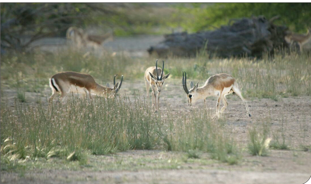
حفاظت داوطلبانه در برخی مناطق آزاد یزد و کرمان از سال ۱۳۸۹ شروع شد، شش سال بعد آنها به‌شکل رسمی عنوان «قرق اختصاصی» دریافت کردند؛ عنوانی که از سال ۱۳۴۶ در قانون شکار و صید مطرح شده بود. ولی دستورالعمل‌های مرتبط با آن تصویب نشده بود. از همین زمان انتقادات به آنها شدت گرفت و دو طیف موافقان و مخالفان روبه‌روی هم ایستادند. موافقان از قرق‌ها به‌عنوان ضرر به‌گیر مناطق چهارگانه نام می‌برند و در مقابل مخالفان می‌گویند قرق‌ها بخشی از حیات‌وحش مناطق را به خود جذب می‌کنند و به‌این‌ترتیب، آمارشان را بالا نشان می‌دهند و براساس همین آمار غیرواقعی پروانهٔ شکار دریافت می‌کنند. باوجود اینکه تنها پنج قرق اختصاصی مجوز فعالیت دریافت کرده‌اند و بیش از ۲۰ منطقهٔ دیگر در انتظار تصویب به‌عنوان قرق اختصاصی یا حفاظتگاه مردمی هستند، اما هنوز اختلافات میان موافقان و مخالفان ادامه دارد. در ادامهٔ همین بحث‌ها، هفتهٔ گذشته نشست با عنوان «حفاظتگاه‌های خصوصی و قرق‌های اختصاصی در ایران: چالش‌ها و راهکارها» در دانشکدهٔ منابع طبیعی دانشگاه تهران برگزار شد و دو طیف موافق و مخالف بار دیگر در یک فضای دانشگاهی دغدغه‌هایشان را مطرح کردند.

انتقاد مدیرکل دفتر حیات‌وحش سازمان حفاظت محیط زیست: جامعهٔ دانشگاهی به‌جای تخطئه، راهکار بدهد