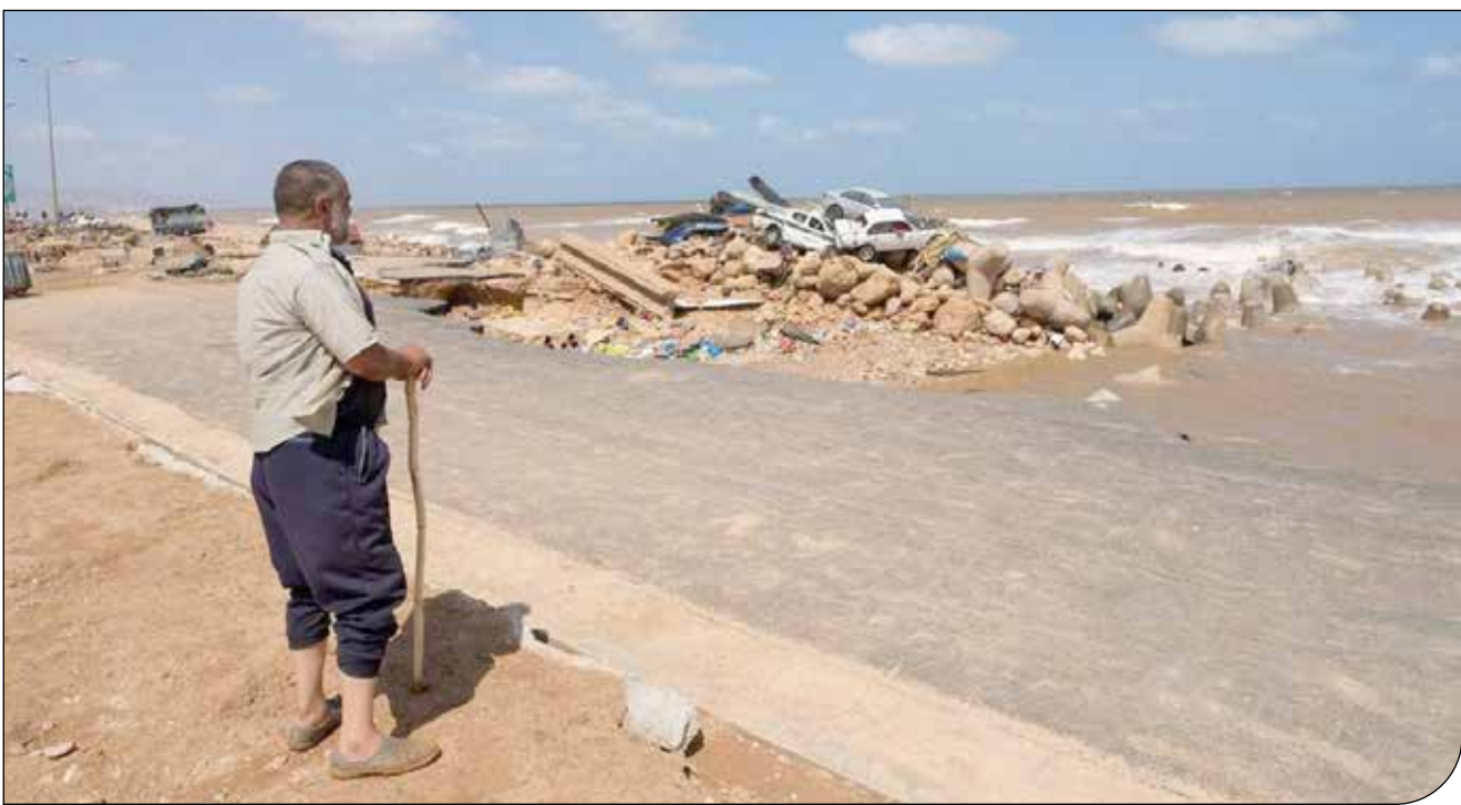
— — —

در طول دو دهه گذشته ۱/۲ میلیارد نفر تحت تأثیر وقایع شدید آب‌وهوایی ناشی از بحران اقلیمی قرار گرفته‌اند