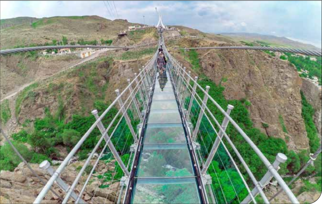
— 33 —

او ابراز امیدواری کرد این بنای تاریخی با تغییر رویکردها نجات پیدا کند و شاهد از بین رفتن تدریجی اثر تاریخی دیگری نباشیم.