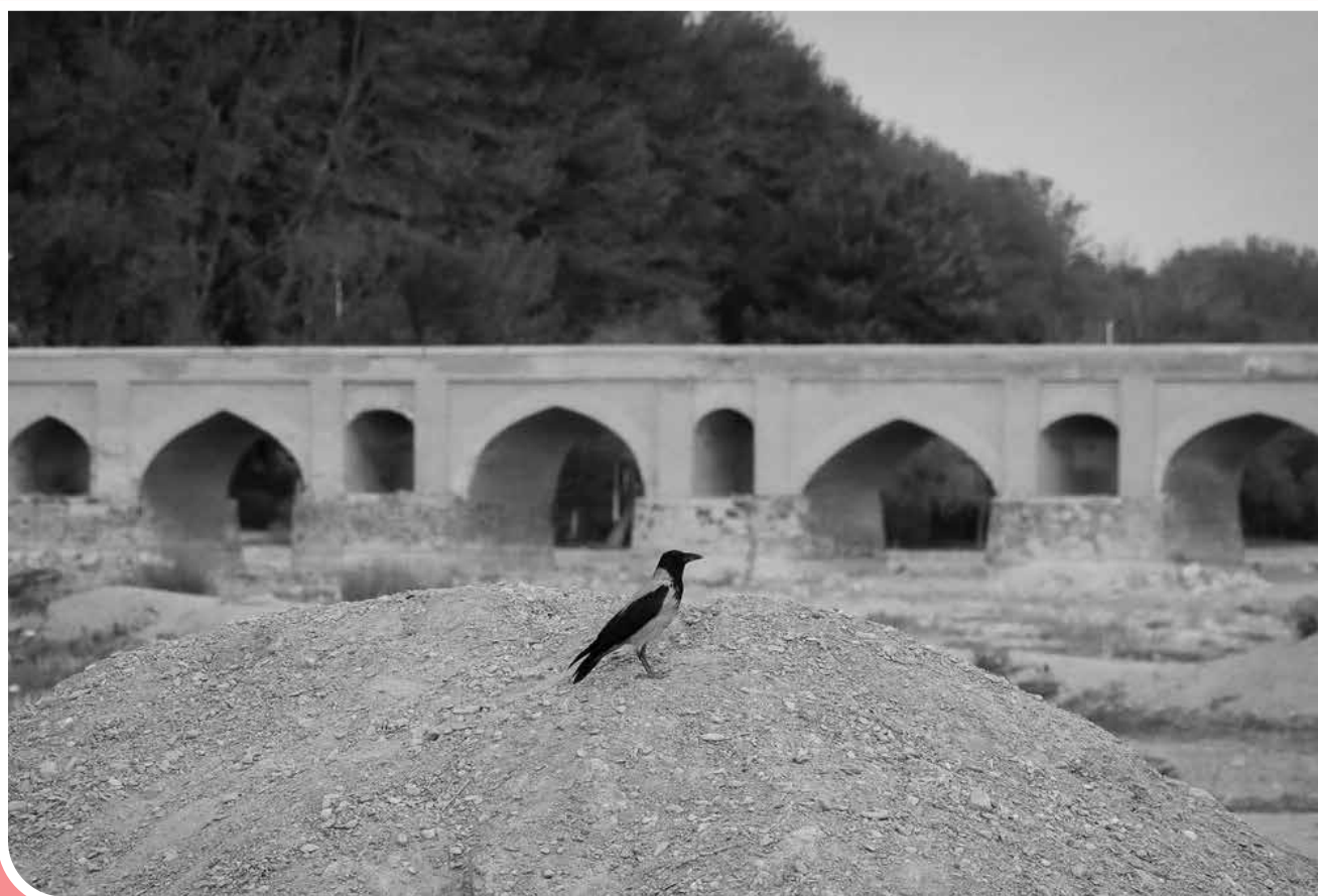
«زاینده‌رود» مهم‌ترین رودخانه فلات مرکزی که سنگ‌بنای تمدن منطقه مرکزی ایران به‌شمار می‌رود و رسالتش را در نامش مستتر کرده، چند سالی است زاینده‌گانش قربانی خشکسالی و مدیریت نامناسب منابع آبی در مسیر زندگی بخشی‌اش شده و جز نام و بستری تشنه رمقی بر تن این شاه‌رگ حیاتی فلات مرکزی ایران باقی نمانده است.