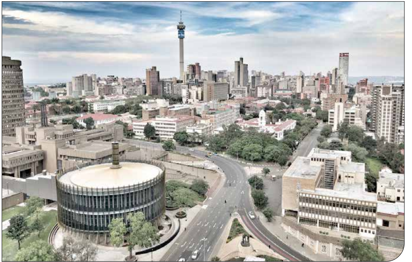
AP - (5)

مدیریت شهری کیپ‌تاون با برنامه‌ریزی یکپارچه، طوری خدمات خود را ارائه می‌دهد که با محیط‌های طبیعی سازگار باشد و منابع را به گونه‌ای صرف می‌کند که برای حال و آینده خطری نداشته باشد