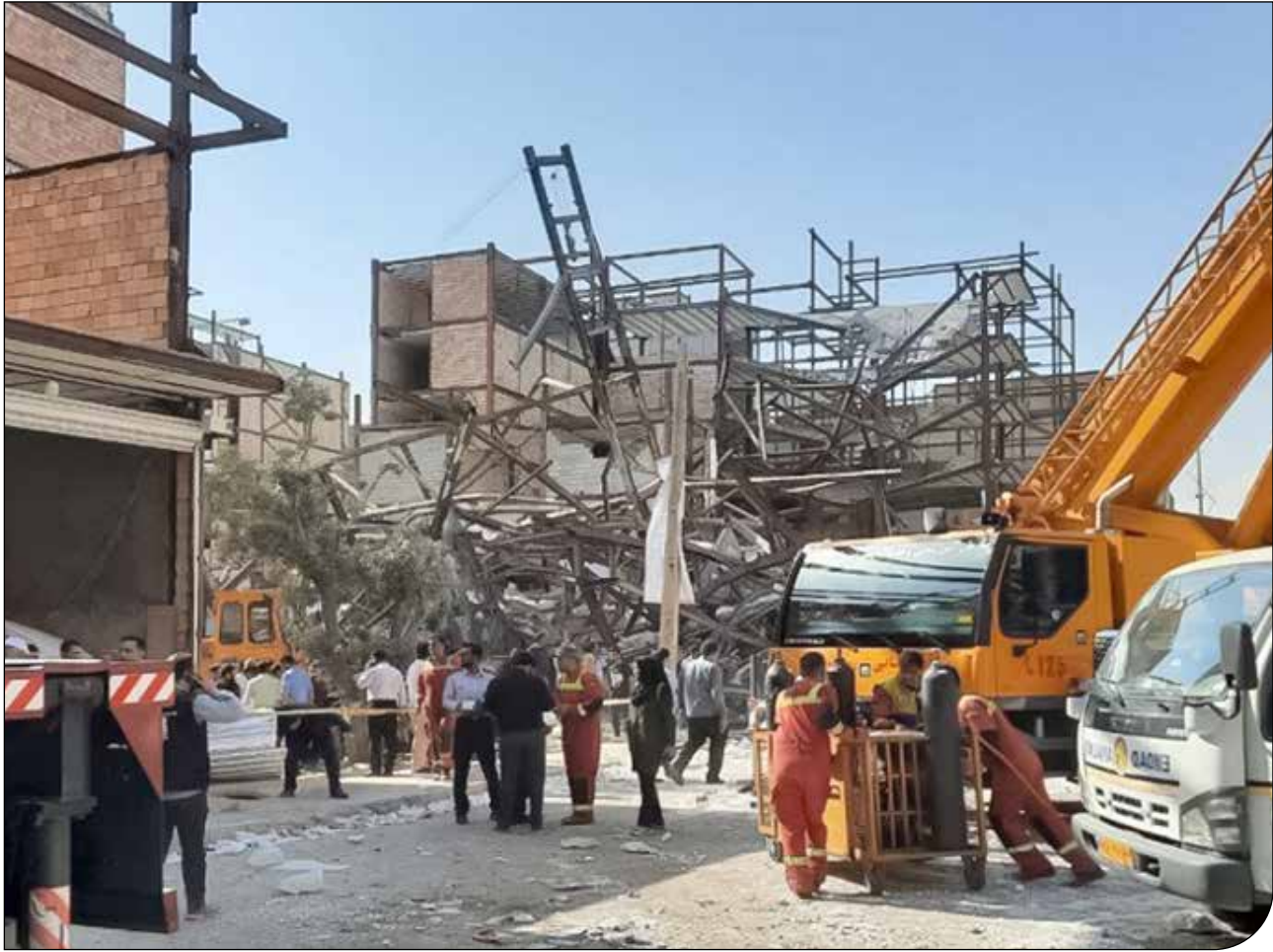
— تیرا —