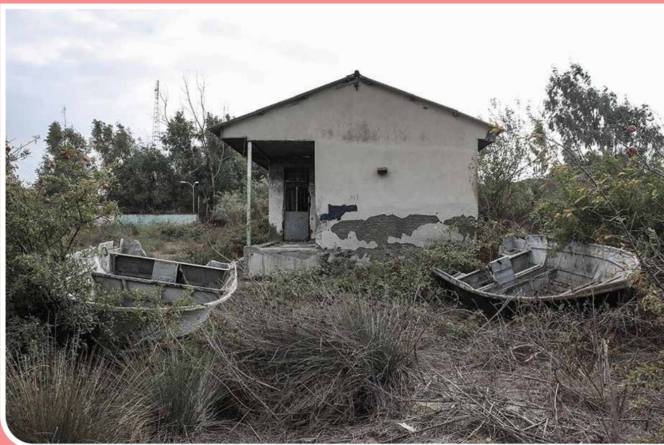
جزیره «آشوراده» در بندر ترکمن در استان گلستان واقع شده و «آشوراده» یک لفظ در زبان ترکمنی به معنی «جزیره آشور» است. این جزیره دارای بیش از هزار نفر سکنه بود که به دامداری، کارگری، ماهی‌گیری و کسب و کار مشغول بودند، اما پس از وقوع سیل در سال ۷۲، این جزیره از وجود سکنه تخلیه شد. حالا به‌منظور رونق دوباره این جزیره لازم است مسئولان چاره‌ای بیندیشند.