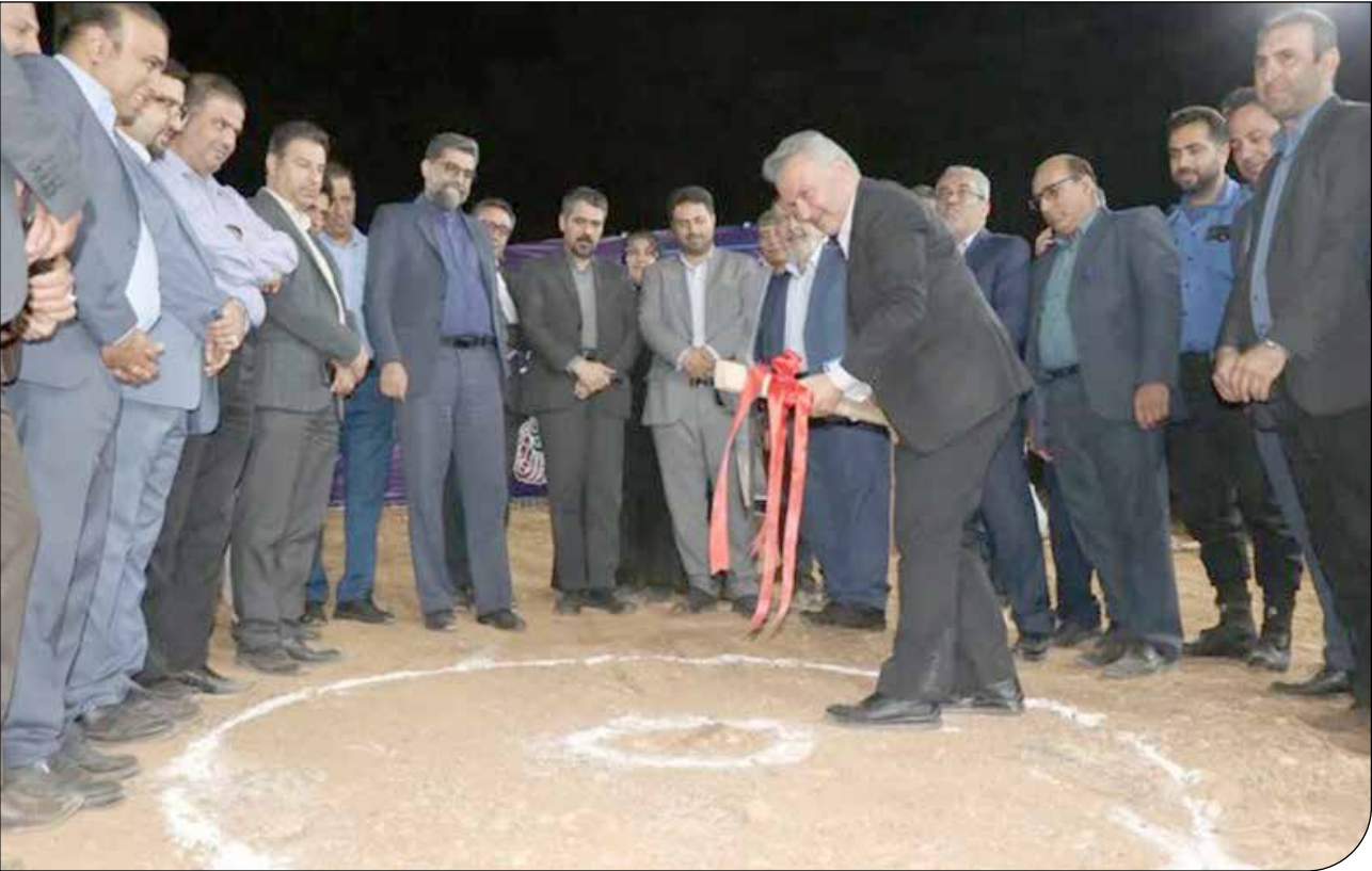
مدیرکل میراث فرهنگی، گردشگری و صنایع دستی، علیرضا زاهدی، در کنار مدیرعامل شرکت شهرک‌های صنعتی فارس، محمدعلی باقری، و سایر مسئولان استان فارس، در مراسم افتتاحیهٔ مجتمع صنعتی شیراز، در حال بریدن روبان است.