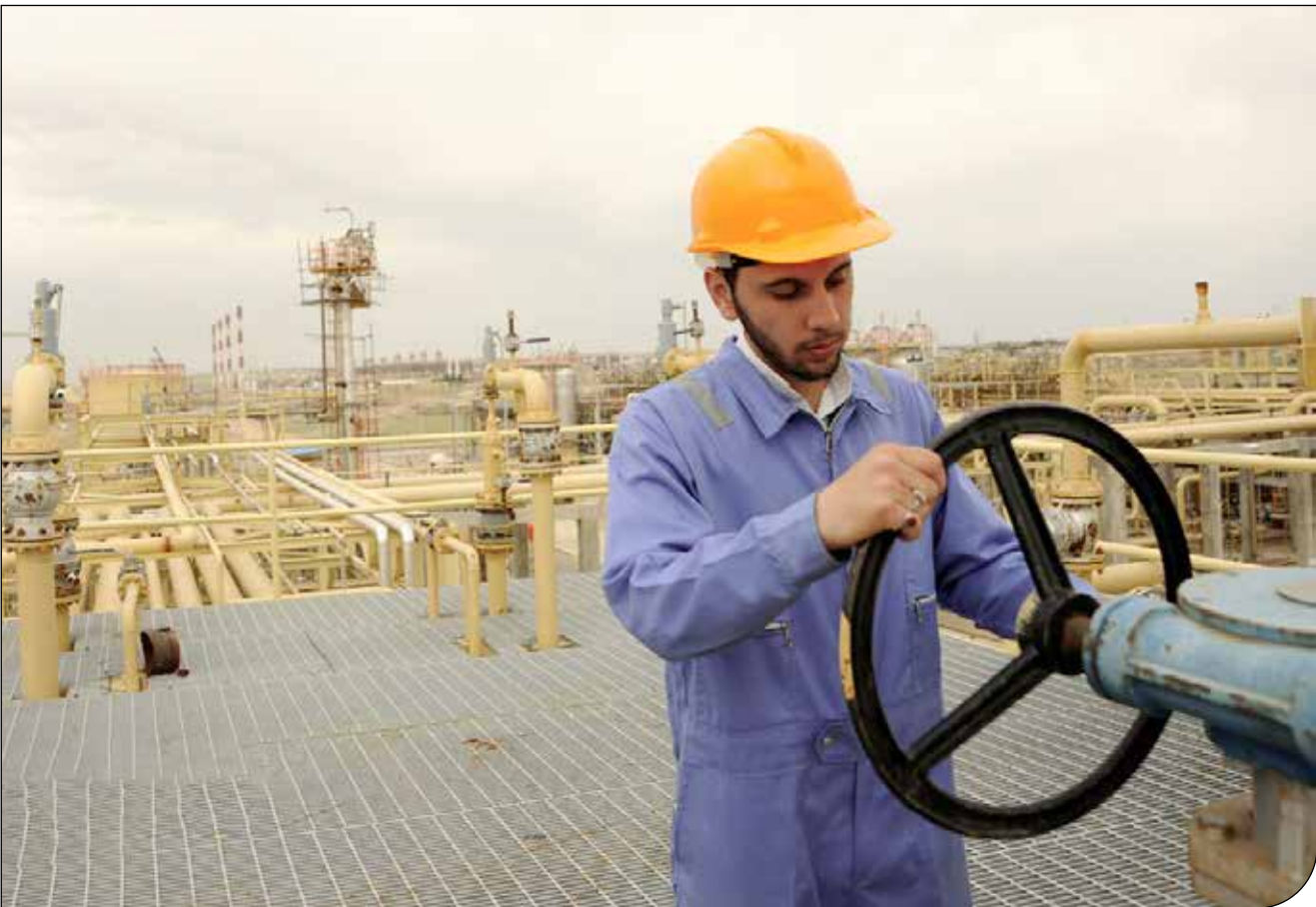
— — — — — [۵]

براساس «سند تراز تولید و مصرف گاز طبیعی» در سال ۱۴۰۴ با روزانه ۲/۱۵ میلیون مترمکعب کسری گاز مواجه می‌شویم