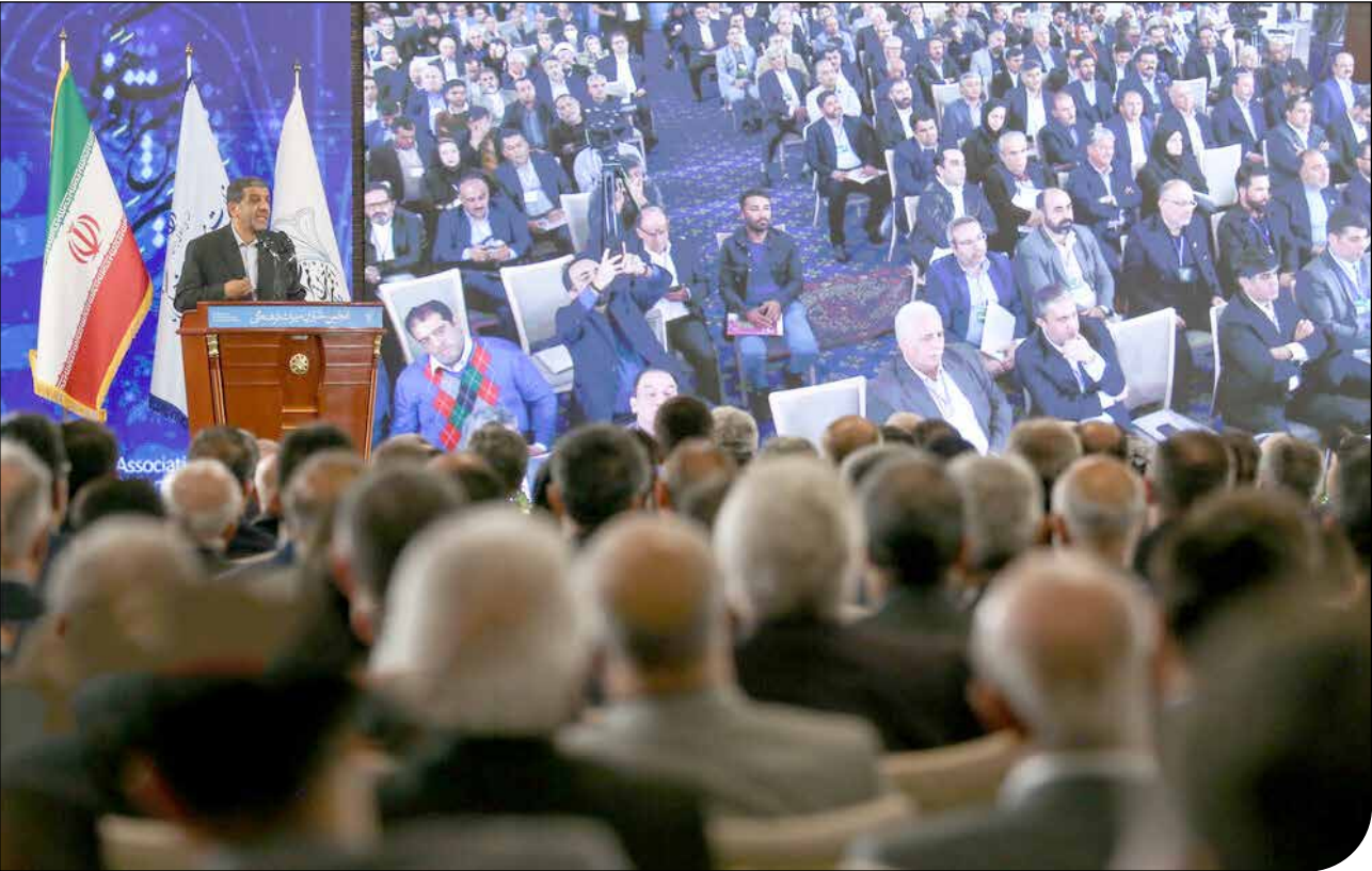
| ایستاد | [۱۵]