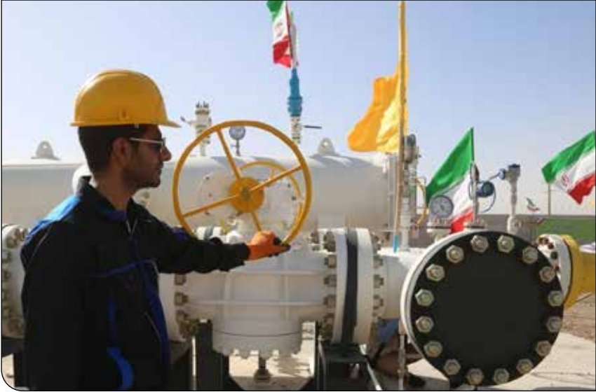
نمای کلی از خط انتقال گاز در استان سیستان و بلوچستان

او ادامه داد: همچنین، ۳۰ شهر باقیماندهٔ سیستان‌وبلوچستان