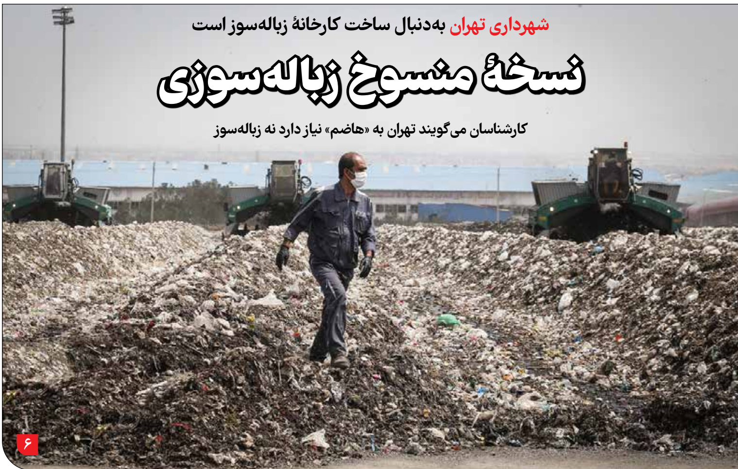
شهرداری تهران به‌دنبال ساخت کارخانه زباله‌سوز است