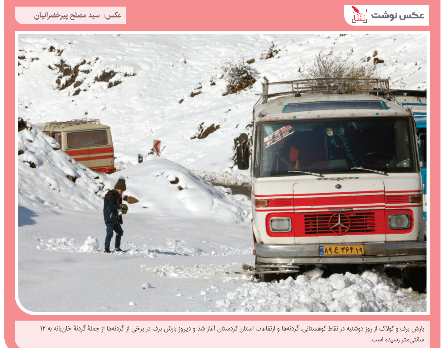
بارش برف و کولاک از روز دوشنبه در نقاط کوهستانی، گردنه‌ها و ارتفاعات استان کردستان آغاز شد و دیروز بارش برف در برخی از گردنه‌ها از جمله گردنهٔ خان‌بانه به ۱۲ سانتی‌متر رسیده است.