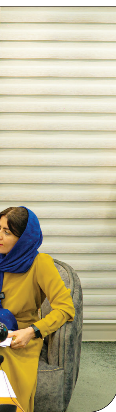
موسسه دارالاکرام |

رئیس پلیس امنیت اقتصادی فراجا از اجرای طرح ویژهٔ برخورد با احتکار شیرخشک در کشور خبر داد که طی آن نزدیک به ۶۵۰ هزار قوطی انواع شیرخشک کشف شده است. به گزارش ایسنا، «سردار حسین رحیمی» با اشاره به اینکه پلیس امنیت اقتصادی با رصد دقیق موضوعات و مسائل اقتصادی کشور سعی و تلاش خود را به‌کار بسته است تا اجازه ندهد برخی سوداگران اقتصادی برای کسب منافع بادآورده اقتصاد کشور را به چالش بکشانند، گفت: در حال حاضر با پیگیری‌های صورت‌گرفته از سوی پلیس امنیت اقتصادی فراجا در استان‌های قزوین، البرز و خراسان رضوی سه انبار احتکار شیرخشک شناسایی و با آنان برخورد شده است. یکی از این انبارها در یکی از شهرک‌های صنعتی واقع در استان البرز بود که از آن ۱۷۲ هزار و ۴۴۰ قوطی شیرخشک و همچنین مقدار ۲۹ هزار و ۷۰۰ کیلوگرم مواد اولیهٔ شیرخشک کشف و ضبط شد. رئیس پلیس امنیت اقتصادی فراجا افزود: همچنین، در عملیات دیگر مأموران پلیس امنیت اقتصادی فراجا با استفاده از منابع اطلاعاتی در یکی از شهرک‌های صنعتی استان خراسان‌رضوی تعداد ۲۴۳ هزار و ۵۵۹ قوطی پودر شیرخشک ۴۰۰گرمی در برندهای مختلف و تعداد ۳۲۰ هزار قوطی ۴۰۰گرمی انواع شیرخشک را کشف و ضبط کردند. در استان قزوین نیز از یک انبار مقادیر قابل‌توجهی شیرخشک احتکارشده کشف و ضبط شد.