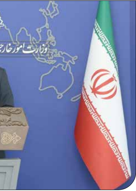
— ۱ — — ۲ — — ۳ —