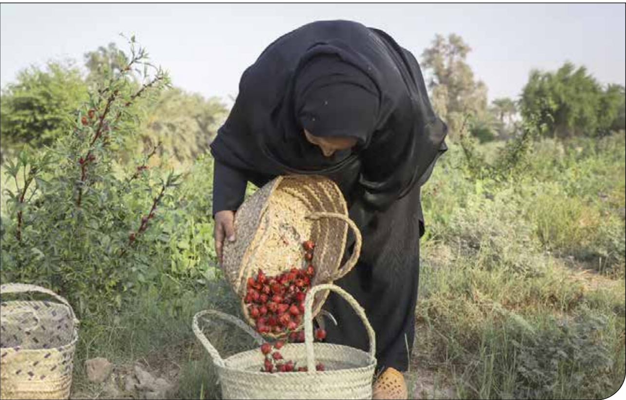
سرخ و ترش