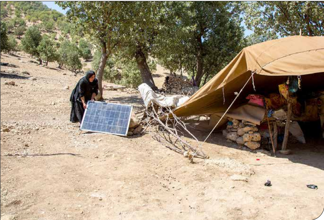
- ۳ -

اما در حال حاضر عمده تأمین برق عشایر از گازوئیل است