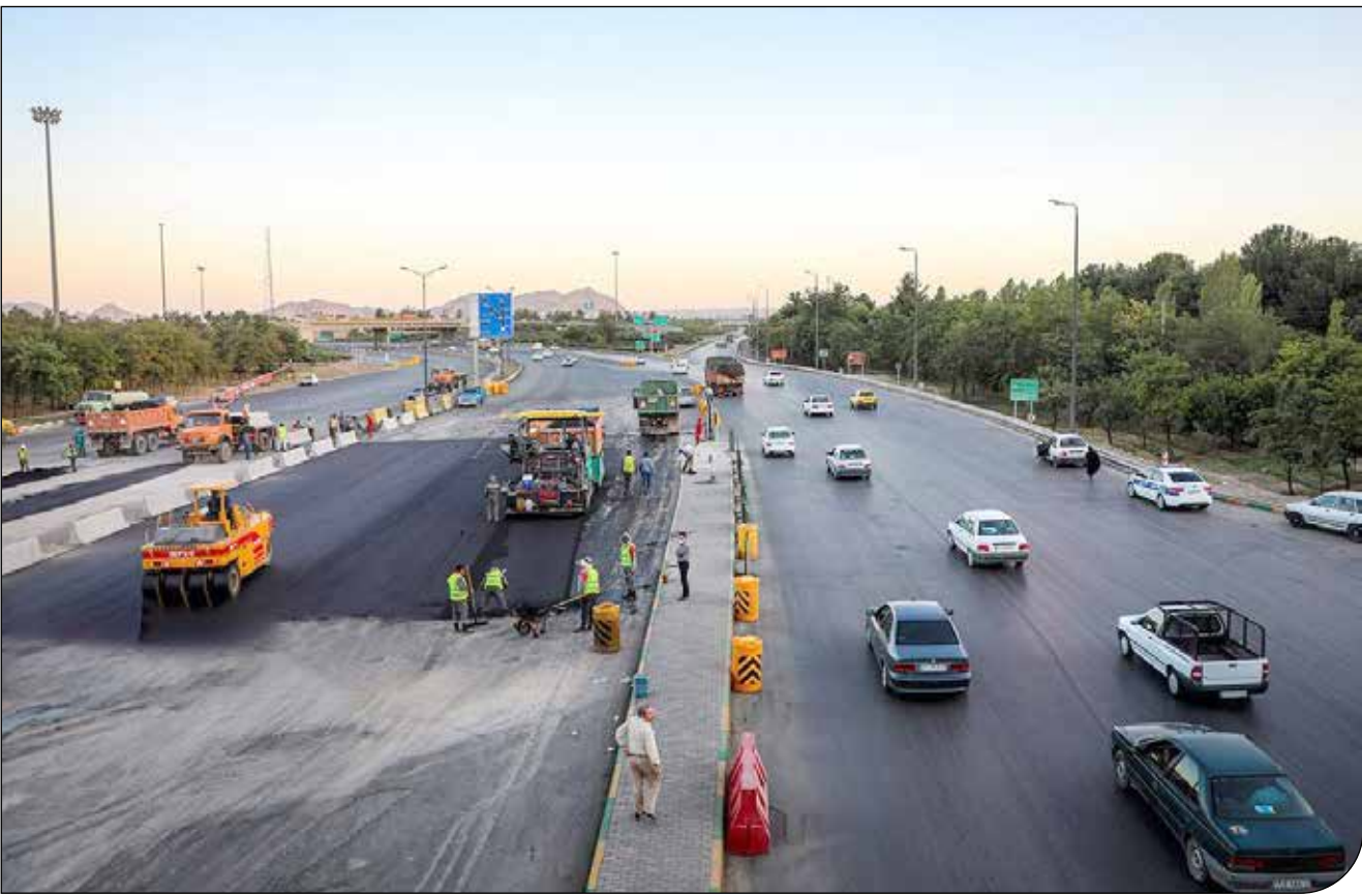
سازمان حفاظت محیط زیست

عضو شورای عالی محیط زیست: برای ساخت آزادراه، چه از پارک ملی بگذرد و چه در منطقه حفاظت‌شده نباشد، باید گزارش ارزیابی تهیه شود