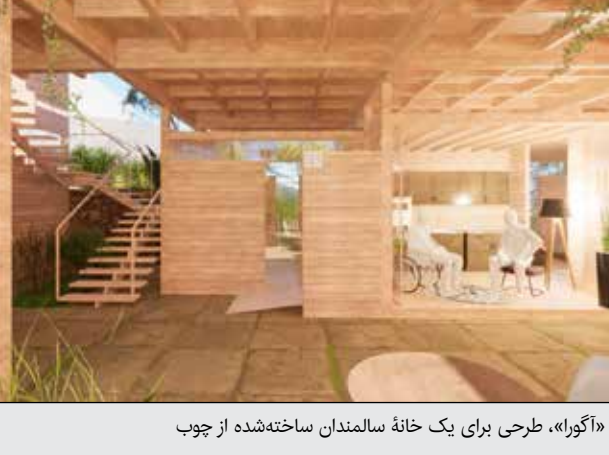
«آگورا»، طرحی برای یک خانه سالمندان ساخته‌شده از چوب

ایپام ما مفهوم «پایداری» در دنیای گسترده معماری و طراحی، الهام‌بخش ساخت سازه‌های جدید هماهنگ با محیط زیست شده و در مرکز توجه قرار گرفته است. استفاده از چوب، یک ماده کلاسیک با پتانسیل بسیار زیاد، برای کاهش تأثیرات اکولوژیکی ما، نمونه قابل‌توجهی از اجرای این حرکت است. دو ویژگی متمایز چوب، یعنی تجدیدپذیری و بی‌طرفی کربن، الهام‌بخش روش‌های خلاقانه در میان معماران در سراسر جهان است. طیف وسیعی از پروژه‌های معماری، از امکانات حیاتی مراقبت‌های بهداشتی گرفته تا