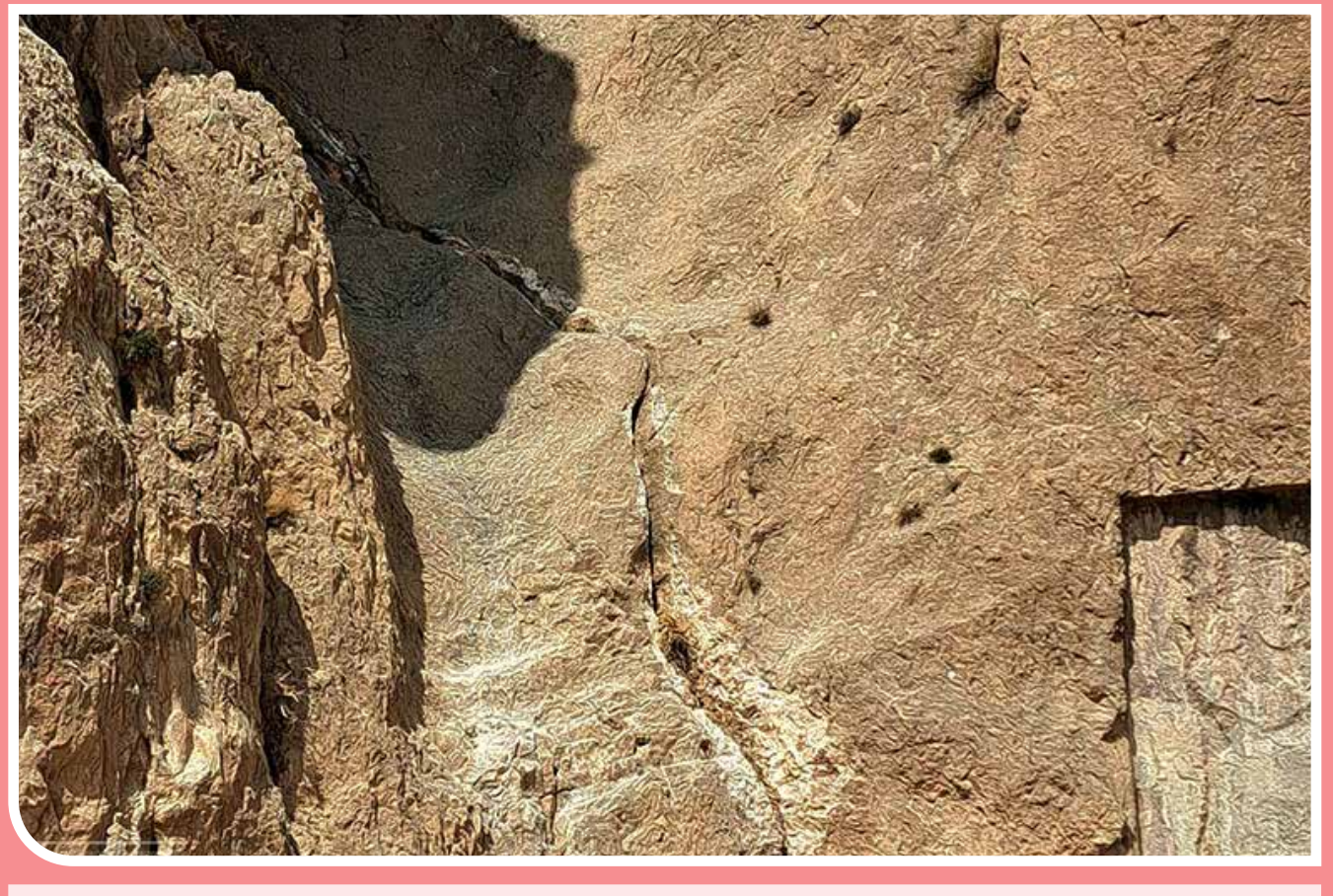
مطالعات و پژوهش‌های انجام‌شده از دشت مرودشت نشان می‌دهد پهنای فرهنگ فرستاد در منطقه تاریخی «نقش رستم» به حدود نیم‌متر تا ۷۰ سانتی‌متر رسیده است. این شکاف‌ها به فاصله ۱۰ تا ۱۵ متری منطقه باستانی نقش رستم ایجاد شده و با اینکه هرساله این شکاف‌ها با شن و ماسه پر می‌شوند، اما دوباره سر باز می‌زنند.