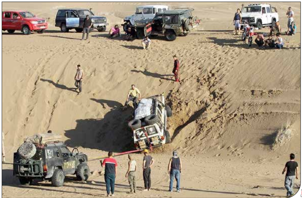
ایرنا - [عکس]

یک فعال صنعت گردشگری می گوید بسیاری از فعالان غیرمتخصص گردشگری با تبلیغات مجازی به صورت غیرمجاز تورهای گردشگری برگزار می کنند و منجر به تخریب محیط زیست می شوند