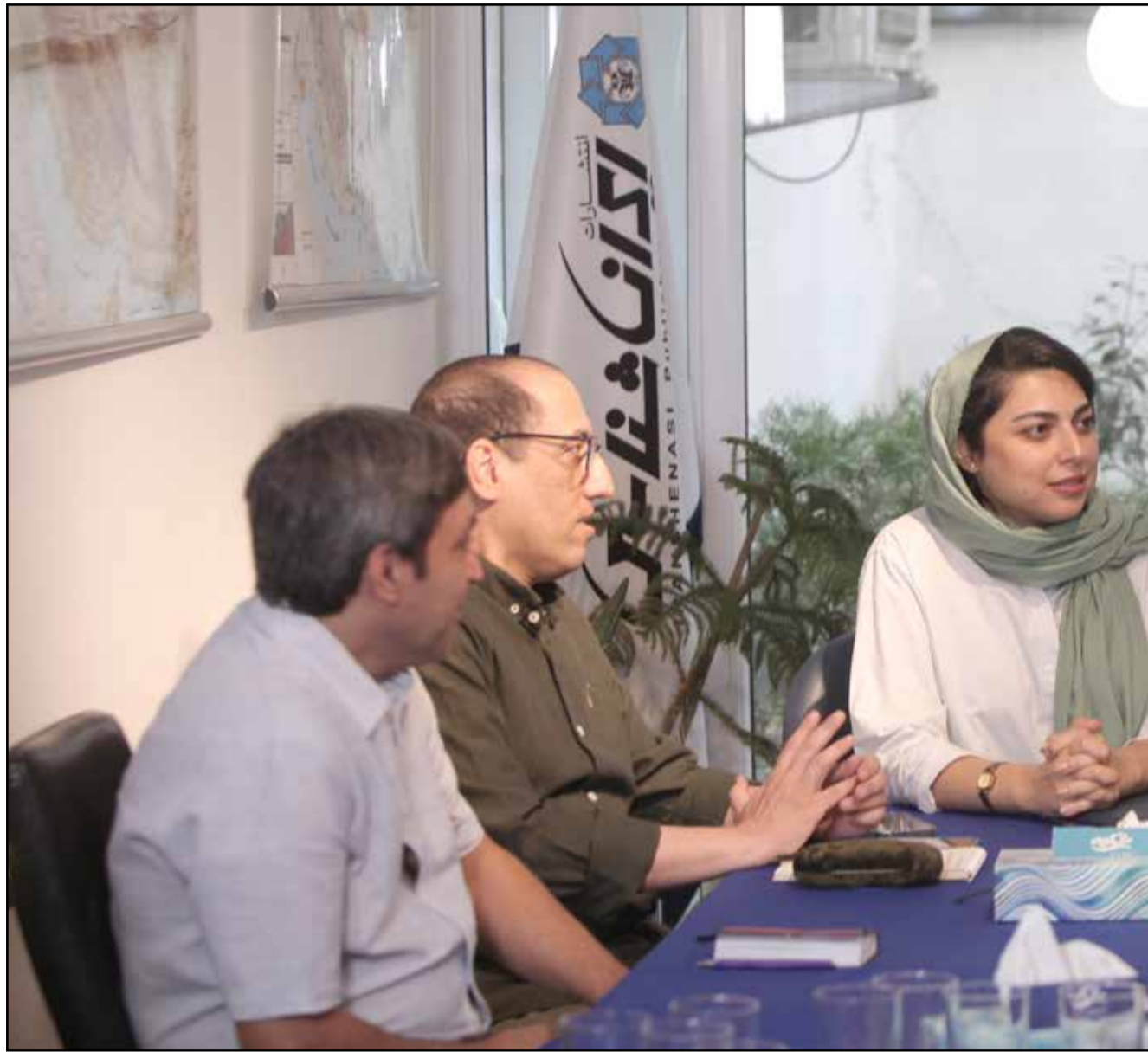
های تقویت «گردشگری پایدار» در کشور را بررسی کردند