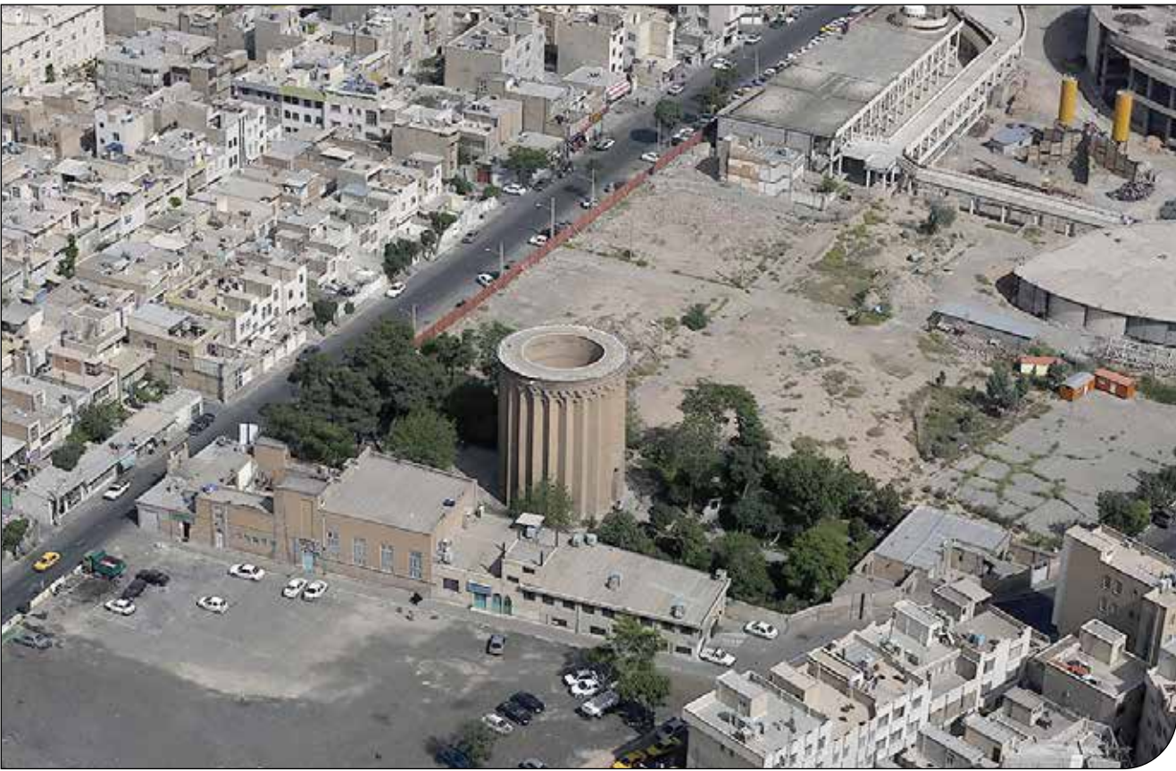
| امیر عسگری |

تمامی مداخلات در حوزه‌های مختلف تنها زمانی سودمند خواهد بود که تأثیرات نهایی آنها در بلندمدت ارزیابی ارزشیابی و سنجیده شود و ابعاد آشکار و نهان آنان قابل اندازه‌گیری باشد