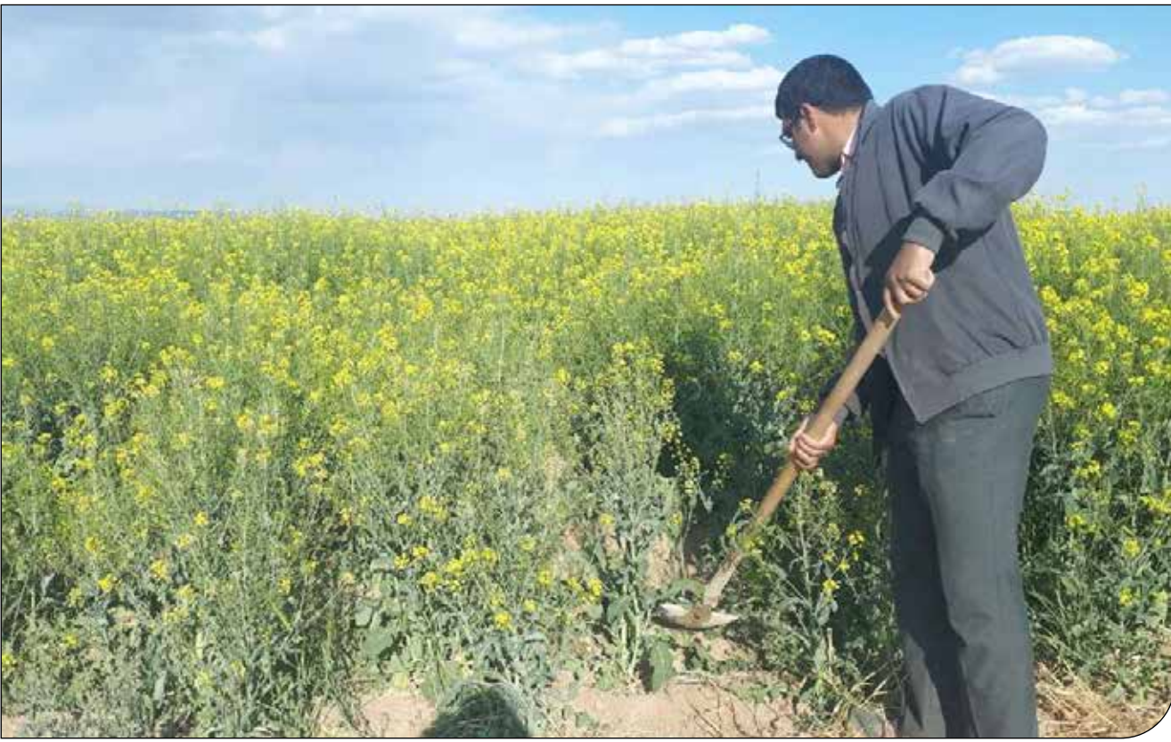
تولید روغن کلزا در استان خوزستان

به نظر می‌رسد نرخ هر کیلو کلزا براساس محاسبات سال‌های قبل که دو برابر قیمت خرید تضمینی گندم تعیین می‌شد، حدود ۳۹ هزار تومان است