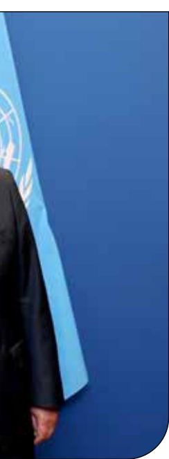
ریاست جمهوری | ۱۳۹۱

به گزارش روابطعمومی قوه قضائیه، همایش تقدیر از ۱۰۰ دهیار برتر در اجرای حدنگاری اراضی کشاورزی و روستایی سه شنبه با حضور امین‌حسین رحیمی وزیر دادگستری، حسن بابایی رئیس سازمان ثبت اسناد و املاک کشور، مهدی سلیمی رئیس سازمان شهرداری‌ها و دهیاری‌ها کشور، رضا افلاطونی رئیس سازمان امور اراضی کشور، مدیران کل ثبت اسناد استان ها، مدیران امور اراضی استان‌ها و دهیاران منتخب برگزار شد. وزیر دادگستری در این همایش اظهار کرد: همکاری و جدیتی که تاکنون بوده آثار بسیار خوبی برای مردم مخصوصاً کشاورزان خواهد داشت، مالکیت موضوع مهمی بوده و اراضی کشاورزی جزء دارایی افراد است که می‌توانند از آن استفاده بهینه کنند.