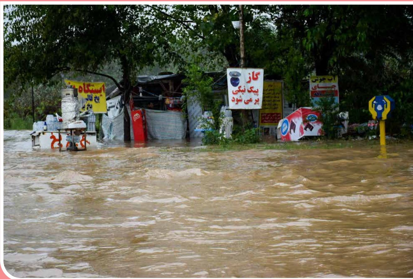
بارش رگباری باران در شامگاه دوشنبه به میزان بیش از ۲۷۱ میلی‌متر موجب آبگرفتگی شدید معابر و جاری شدن سیل در نقاط مختلف شهرستان مرزی بندر آستارا شد. در پی بارش شدید باران پل سبیلی در محور مواصلاتی آستارا به تالش تخریب و بازار بزرگ ساحلی این شهر مرزی نیز دچار آب گرفتگی شدید شده است.