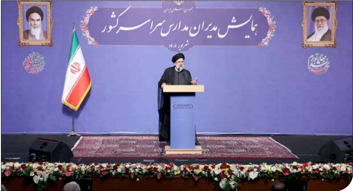
رئیس‌جمهوری ایران، سید ابراهیم رئیسی، در مراسم بیدارن مدارس سراسر کشور، با حضور وزیر آموزش و پرورش، سید محمد هادی، و مدیران مدارس سراسر کشور، در تالار وحدت تهران، سخنرانی کرد.