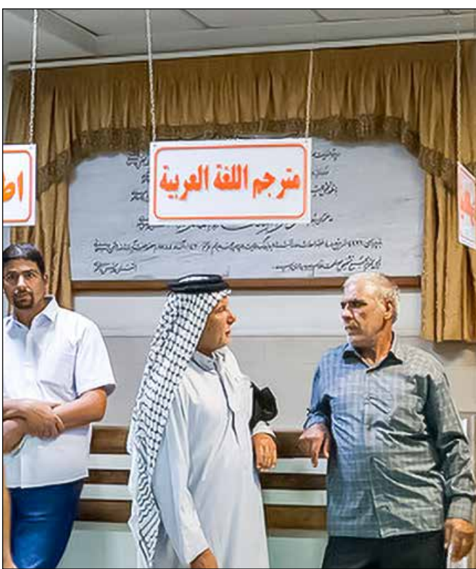
— ایسنا — [۱]

هشدار فعالان حوزهٔ گردشگری پس از اعلام سامانهٔ گردشگری سلامت در استان‌ها