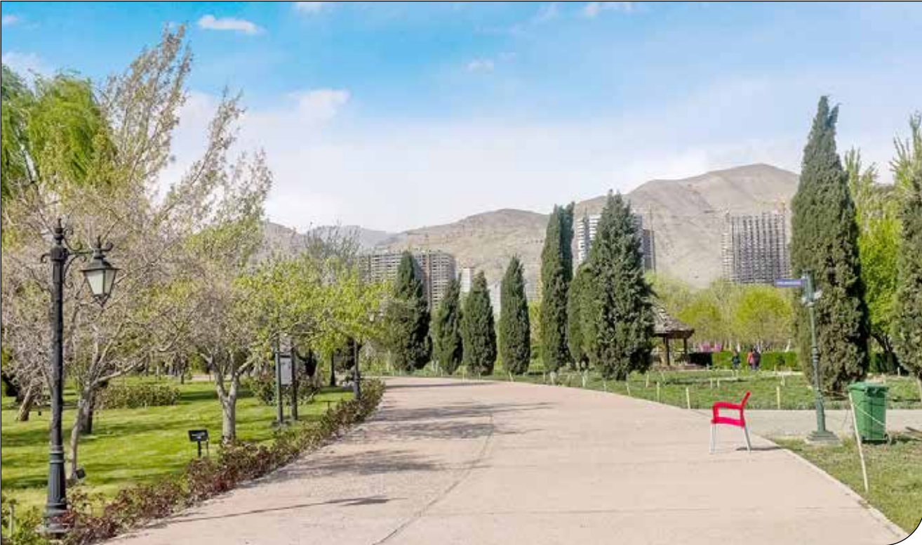
نمای کلی از فضای باغ گیاه‌شناسی

رئیس کمیسیون شهرداری شورای شهر تهران: علاوه بر برج‌های مسکونی ارتش، پروژه مسکونی استادان دانشگاه تربیت مدرس در تفاهم با سازمان نوسازی در حریم این باغ قرار گرفته است