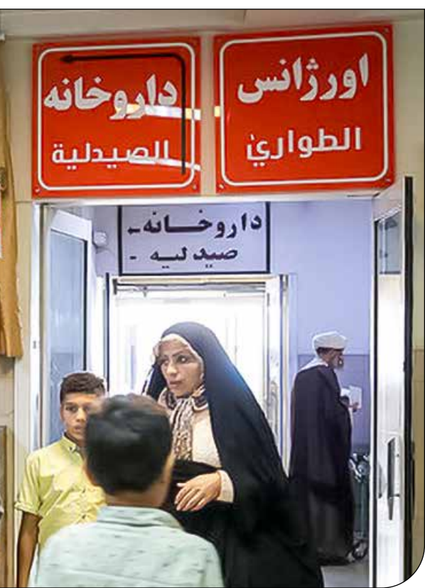
— ایسنا — [۱]

مدیرکل میراث‌فرهنگی، گردشگری و صنایع‌دستی خراسان‌جنوبی گفت: جشنوارهٔ طلای سرخ قاینات به‌عنوان یکی از رویدادهای تائیرگراند جذب گردشگران داخلی و خارجی در سالنامهٔ رویدادهای گردشگری کشور به ثبت رسید. روابط عمومی اداره‌کل میراث‌فرهنگی، گردشگری و صنایع‌دستی خراسان‌جنوبی این خبر را داد و به‌نقل از «هادی شاهوردی» نوشت: «این جشنواره در فهرست رویدادهای گردشگری ایران با شماره ۲۰۲۹۳۶ ثبت و به استان ابلاغ شد.» او افزود: «با توجه به اهمیت معرفی محصول راهبردی زعفران در شاخهٔ گردشگری کشاورزی و علاقهٔ گردشگران به آشنایی با مراحل کاشت، داشت و برداشت آن و کیفیت زعفران قاینات به‌عنوان محصولی با استانداردهای بالا برای عرضه در کشور و صادرات، کمیتهٔ ثبت رویدادهای گردشگری استان، ثبت جشنوارهٔ طلای سرخ را در اولویت برنامه‌های ثبّتی رویدادهای گردشگری خراسان‌جنوبی قرار داد.» مدیرکل میراث‌فرهنگی، گردشگری و صنایع‌دستی خراسان‌جنوبی ادامه داد: «آشنایی با فرآوری، بسته‌بندی همچنین کاربردهای دارویی گیاه زعفران از دیگر اهداف ثبت این جشنواره بوده است. شهروستان قائنات دانشگاه زعفران است و به‌عنوان پایتخت زعفران ایران به همگان معرفی می‌شود.»