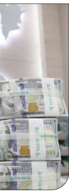
پول‌های آزادشده برای تسویه تعهدات دولت به بانک مرکزی است

در بند دیگری از این نامه آمده است: شوربختانه در نامه مذکور بی آنکه توجهی به مستندات قانونی و مفاد مصوبات و یا مقررات و آیین نامه اجرائی مولد سازی دارایی های دولت که با هدف افزایش بهره وری و توسعه ثروت ملی تدوین، تبیین و ابلاغ شده، شود با انگیزه خاص و ادعاهایی فاقد اتکای قانونی ضمن تخریب ساحت قانون مولد سازی و آیین نامه آن، با استناد به شایعات و پیش فرض های غلط و استنتاج های غیرمنطقی شاذ، استدلال و نتیجه ای سراسر کذب و مغایر با مصالح نظام و ارکان آن‌را به رشته تحریر درآورده است. در این جوابیه تاکید شده است: در تبصره ۴ ذیل ماده ۱۵ آیین نامه اجرائی مولد سازی دارایی های دولت به مراحات اعلام شده که « تمامی عواید حاصل از مولدسازی دارایی های شرکت های مشمول پس از واریز به خزانه بلافاصله به حساب شرکت مربوط واریز خواهد شد.مصرف این عواید در شرکت های مذکور با لحاظ ضوابط حاکمیت شرکتی به تأیید هیأت عالی مولد سازی دارایی های دولت می رسد.»