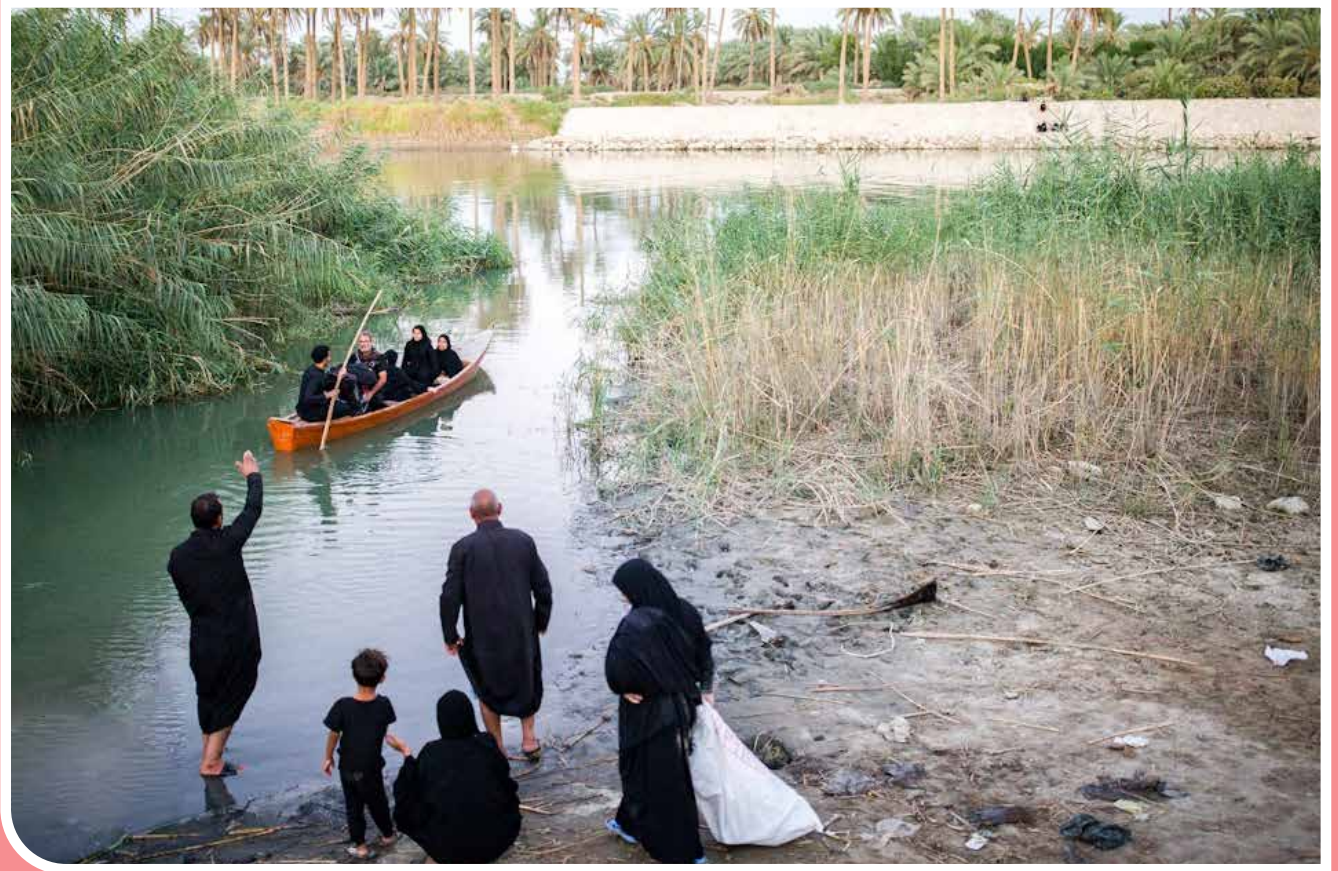
خداین فرات در ایام اربعین، عده‌ای از افرادی که کنار رود فرات زندگی می‌کنند، با قایق‌هایشان زائران را که از مسیر نخلستان به سمت کربلا می‌روند، برای استراحت به خانه‌های خود می‌برند و از آنان میزبانی می‌کنند.