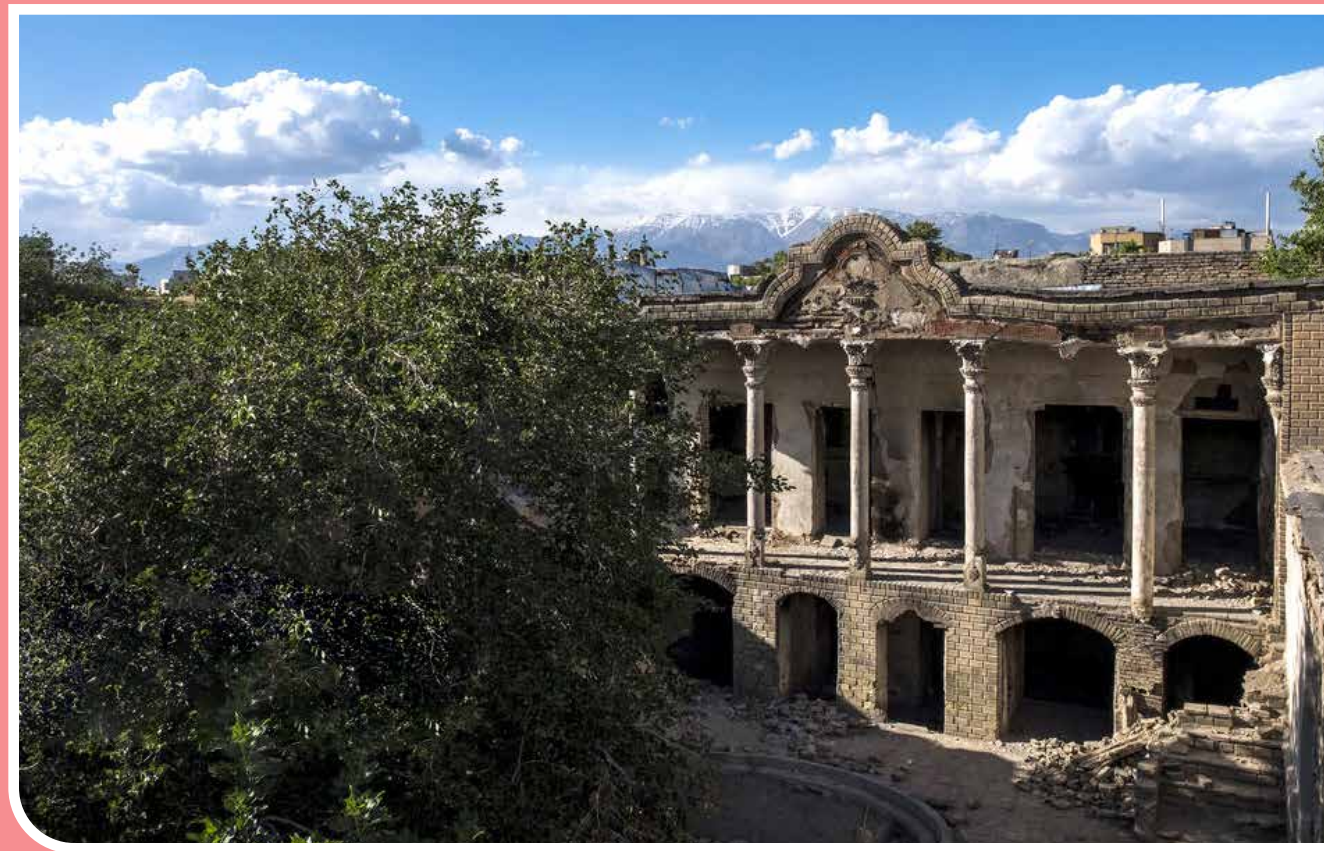
«شکوه السلطنه» یا «امین لشکر» از یکی دو سه سال گذشته که تصاویری از خانه‌ای ویرانه در محله تاریخی پامنار در انتهای پیچ کوچه آقاموسی در فضای مجازی منتشر شد و به‌مرور به رسانه‌ها راه پیدا کرد، نامش را خانه «شکوه السلطنه» گذاشتند؛ همسر عقدی ناصرالدین شاه و مادر مظفالدین شاه که می‌گفتند در اواخر عمر در آن خانه زندگی می‌کرده است. این درحالی است که نقشه‌های ثبت‌شده مربوط به یکی دو قرن قبل تهران، نام این خانه را «امین لشکر» ثبت کرده‌اند. حالا اما این خانه چند سالی است که به یاتوق معتادان تبدیل شده است؛ شرایطی که نهنها خود خانه را با آسیب‌های زیادی روبه‌رو کرده که موجب نارضایتی ساکنان منطقه نیز شده است.