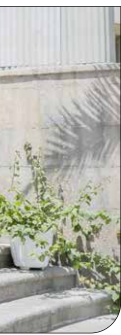
مهرداد — ۱۰۰ —

اگر آموزش همچون سایر کالاهاست و یودلترت‌ها به مدارس بهتر بروند و فقیران و طبقات متوسط در مدرسه‌ا با کیفیت کمتر درس بخوانند، گروه‌های محروم چگونه به زندگی بهتر در آینده امید داشته باشند؟ متأسفانه هر روز اخبار بیشتری از کالایی‌شدن آموزش در ایران به گوش می‌رسد و اگر این روند تغییر نکند، نه‌تنها باید با برابری خداحافظی کرد بلکه امید به آینده بهتر نیز در بسیاری از طبقات رخت بخواهد بست.