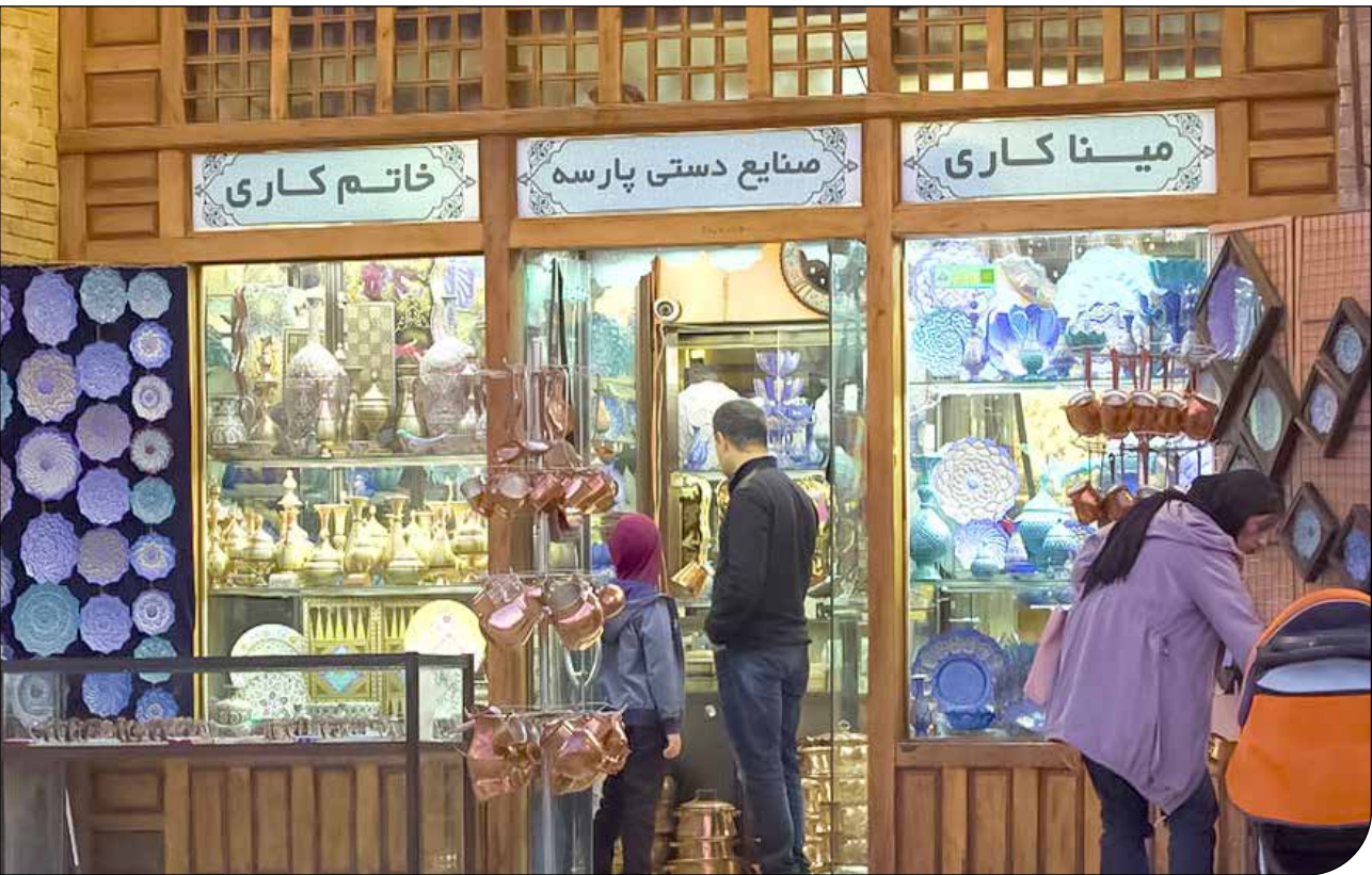
۳