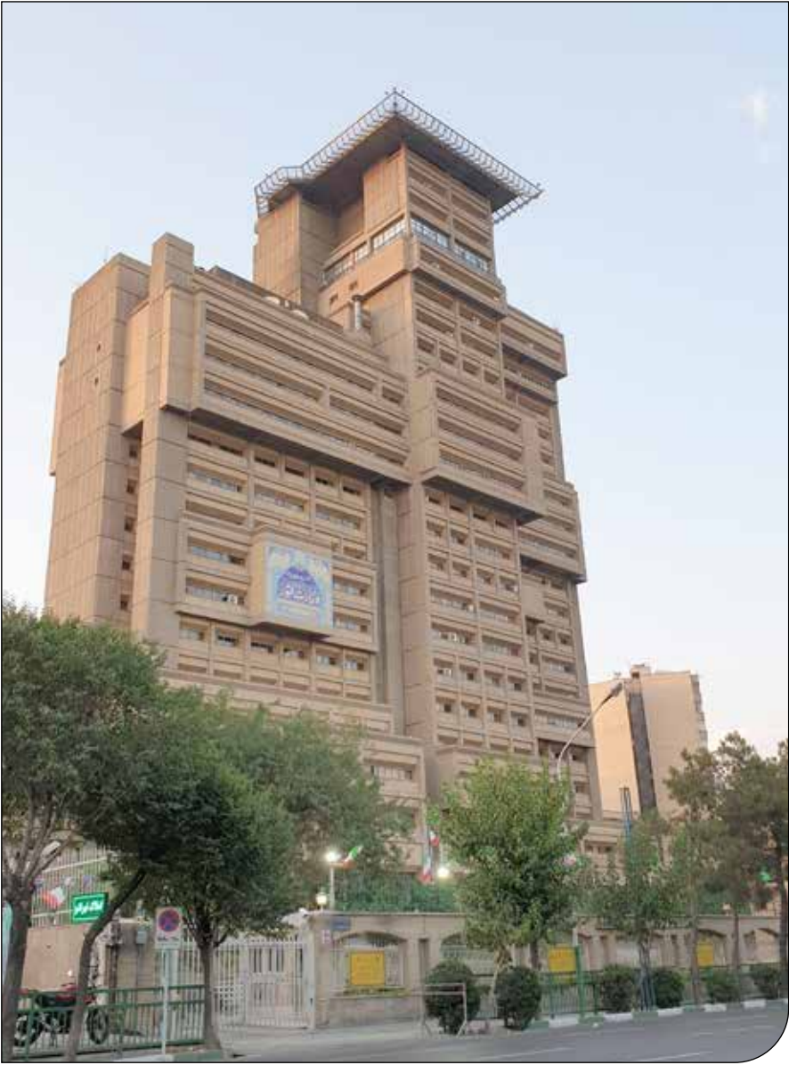
— balachir — (تصویر)

وزارت علوم همچنان در برابر اخراج گسترده استادان دانشگاه ساکت است