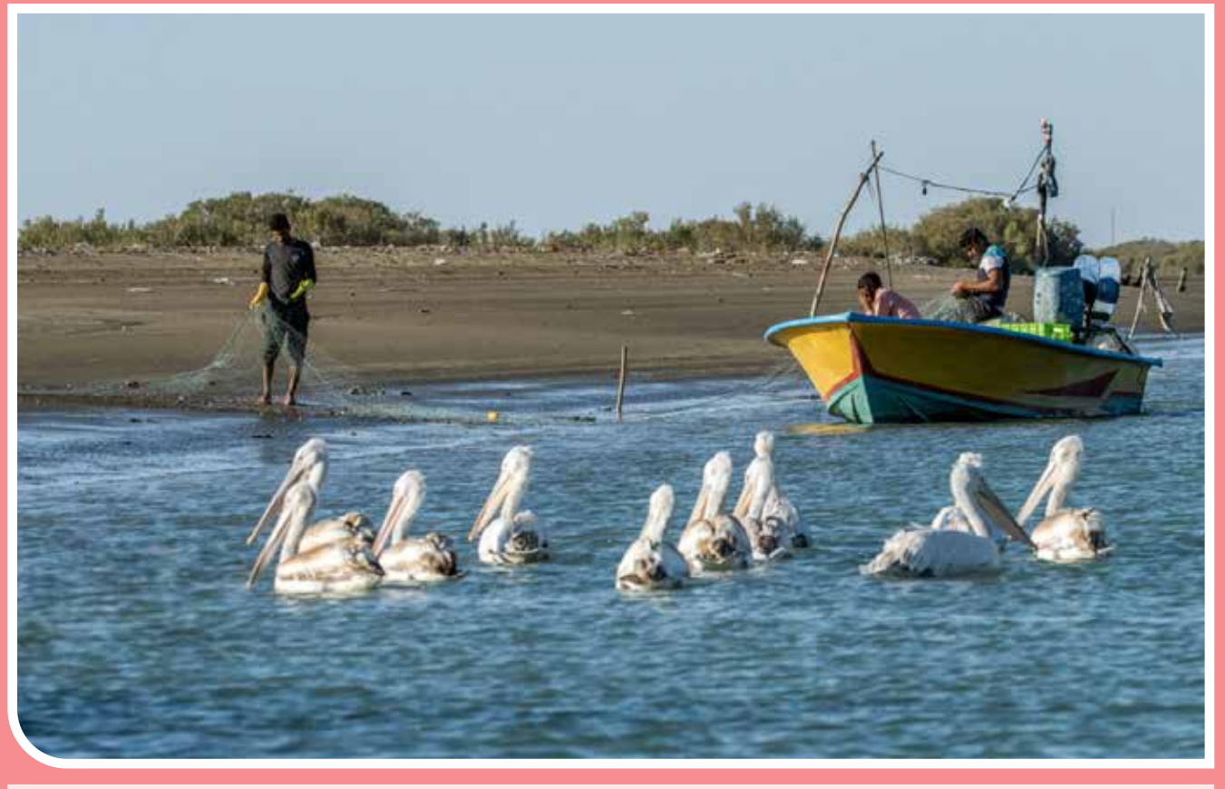
تالاب بین‌المللی آذینی مجموعه تالاب آذینی در جنوب شرقی تنگه هرمز از شگفت‌انگیزترین تالاب‌های گرمسیری کشور و مجموعه‌ای از جنگل‌های مانگرو با دو گونهٔ برتر حرا و چندل است. این تالاب یک پهنهٔ ماندابی گلی، ماسه‌ای و بین جزر و مدی با خورهای بزرگ و کوچک و جزایر کوچک متفرقه است که توسط جنگل‌های حرا و چندل در حد فاصل دو رودخانهٔ گزر و هیوه پوشیده شده است.