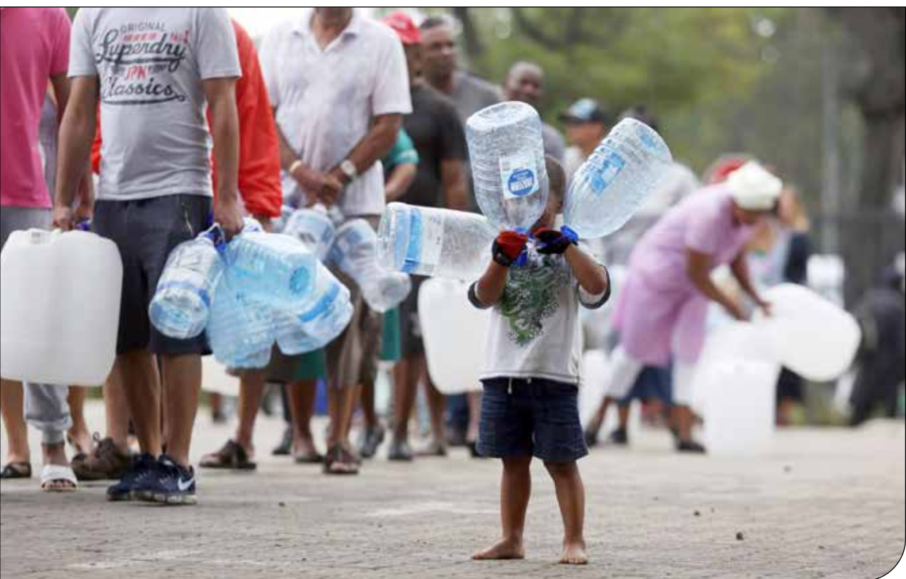
نگاهی به بحران کمبود آب شهر کپ‌تاون، آفریقای جنوبی