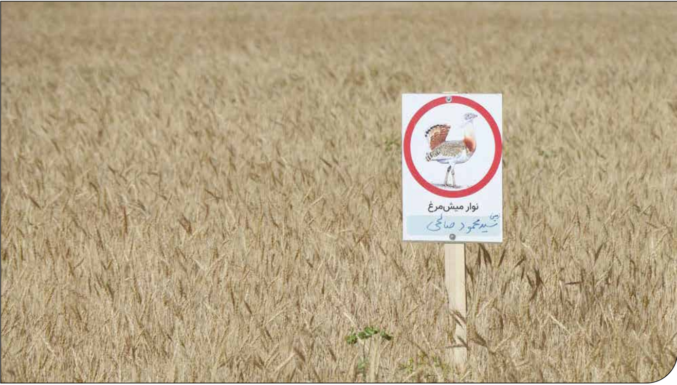
پروژه حفاظت مشارکتی از میش مرغ