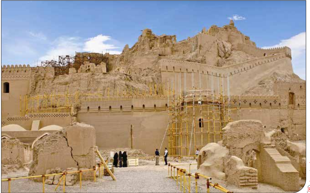
عشایری | ۱۵۶۴۸۳۳۳

گزارش نشست «میراث فرهنگی ناملموس و مسئولیت اجتماعی در مواجهه با حوادث و سوانح»