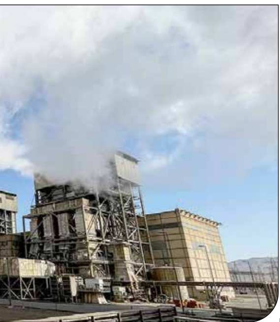
نیروگاه اتمی بوشهر