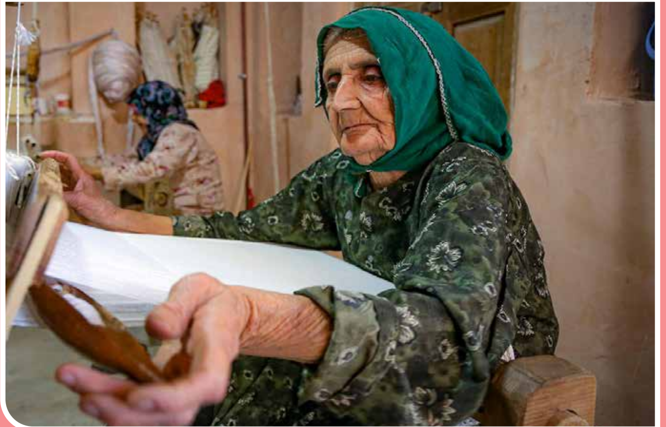
نساجی در روستای تاریخی «رویین» روستای «رویین»، یک روستای بسیار قدیمی است که نام آن در سندی مربوط به قرن نهم هجری قمری ذکر شده است و همین نشان می‌دهد که قدمت این روستا دست‌کم به آن زمان برمی‌گردد. این روستا از زمان‌های دور مرکز نساجی ایران بوده و امروزه نیز نساجی بخشی از فرهنگ و تمدن مردم این روستا است.