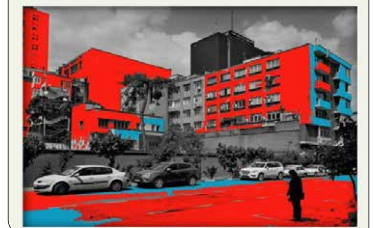
نمایشگاه مجازی عکس‌های «سعید فلاح‌فر» که شامل عکس‌های متفاوتی از نگاه عکس به شهر تهران است، افتتاح شد. به گزارش مهر، فلاح‌فر با انتخاب‌های ویژه و ویرایشی ساده و خلاقانه در فضای دیجیتال به‌معنایی کاملاً متفاوت برای این عکس‌ها اشاره دارد. ترکیبی از تلخی و شیرینی که زبان همدار است