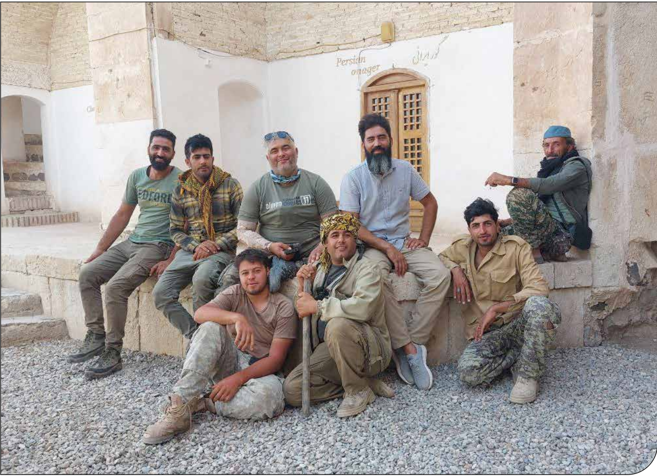
علی ییگی، رئیس پارک ملی کویر

رئیس پارک ملی کویر: اگر به این مرحله برسیم که به جامعه حاشیه مناطق پاسبخو باشیم، می توانیم بگوئیم یک راهبرد داریم